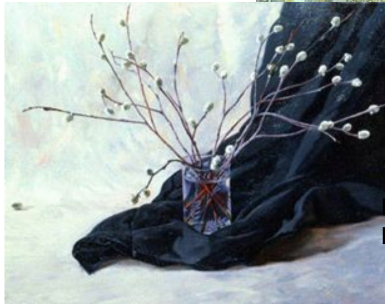
Е. Бирюков "Весенний натюрморт"