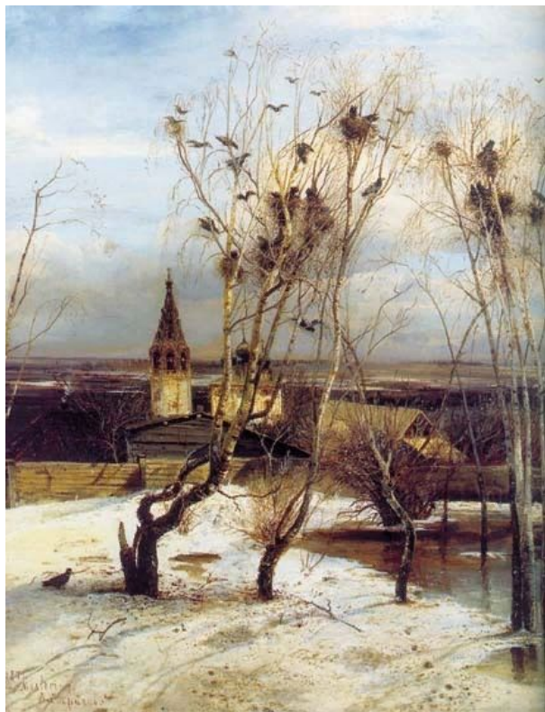
«Ранняя весна. Оттепель»