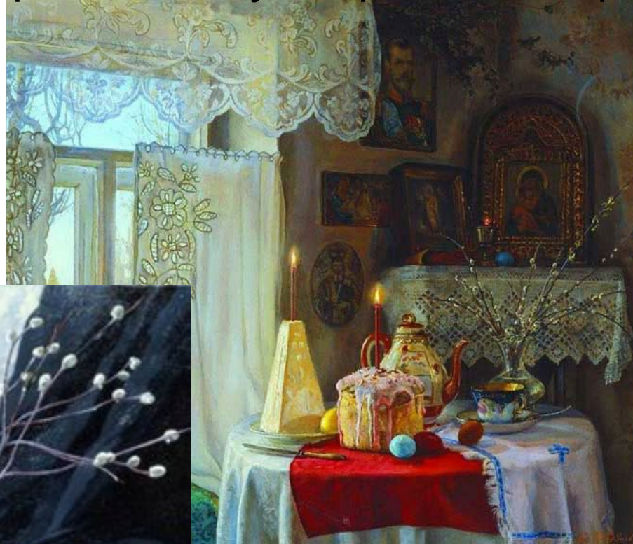
И.Каверзнев. Светлая Пасха

Воскресение Христово ( Пасха ) — это самый главный христианский праздник, установленный в воспоминание Воскресения Иисуса Христа из мертвых.