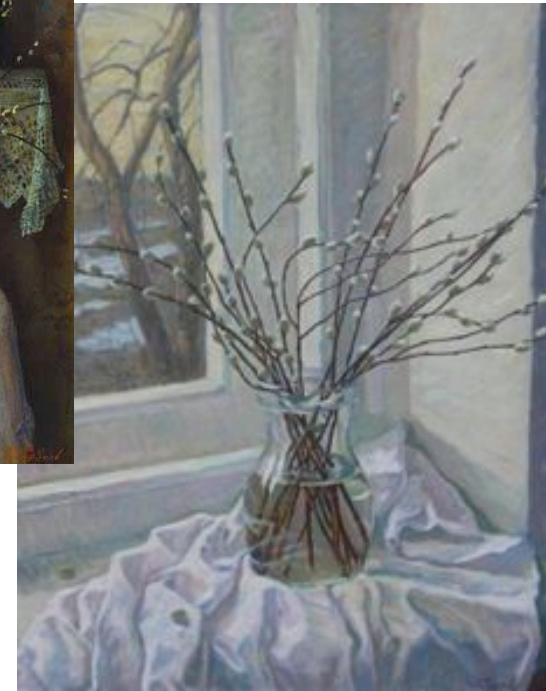
С. К. Чаплыгин.