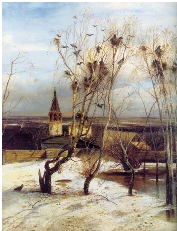
А. Саврасов «Грачи прилетели»