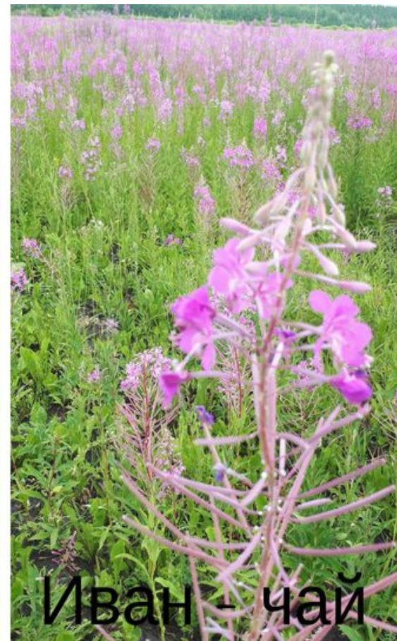
Иван - чай