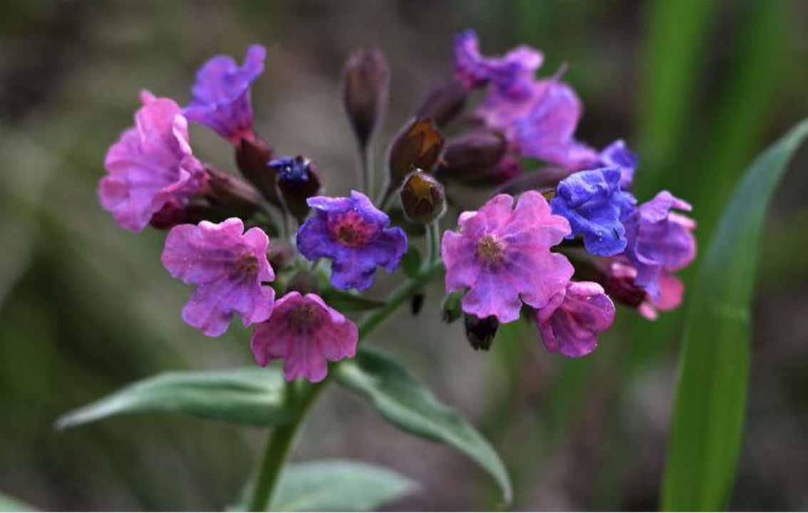
М Е Д У Н И Ц А