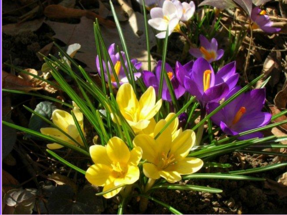
К Р О К У С