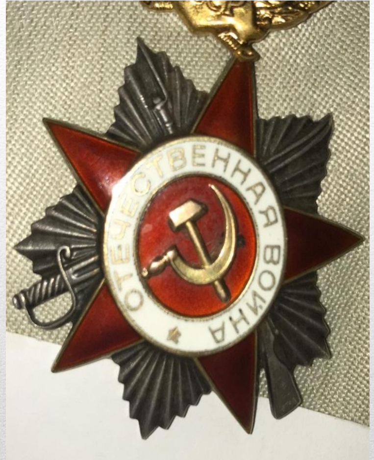
Орден Отечественной войны 2 степени