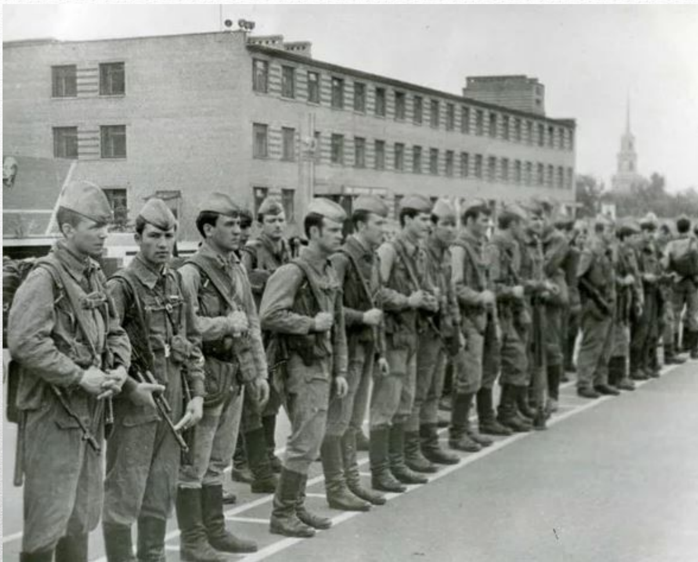
Куйбышевское воздушно-десантное командное училище