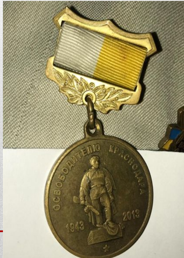
Медаль За освобождение Краснодара