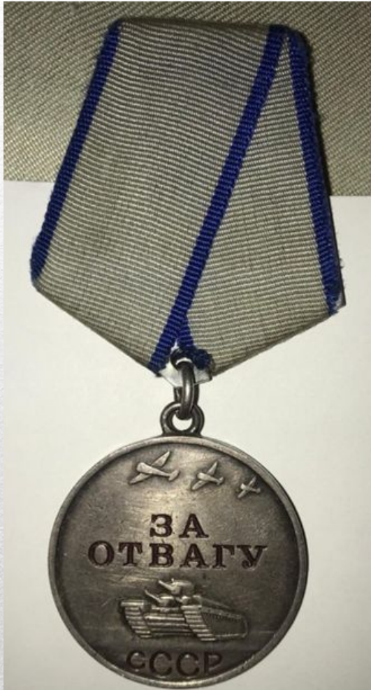
Медаль За Отвагу