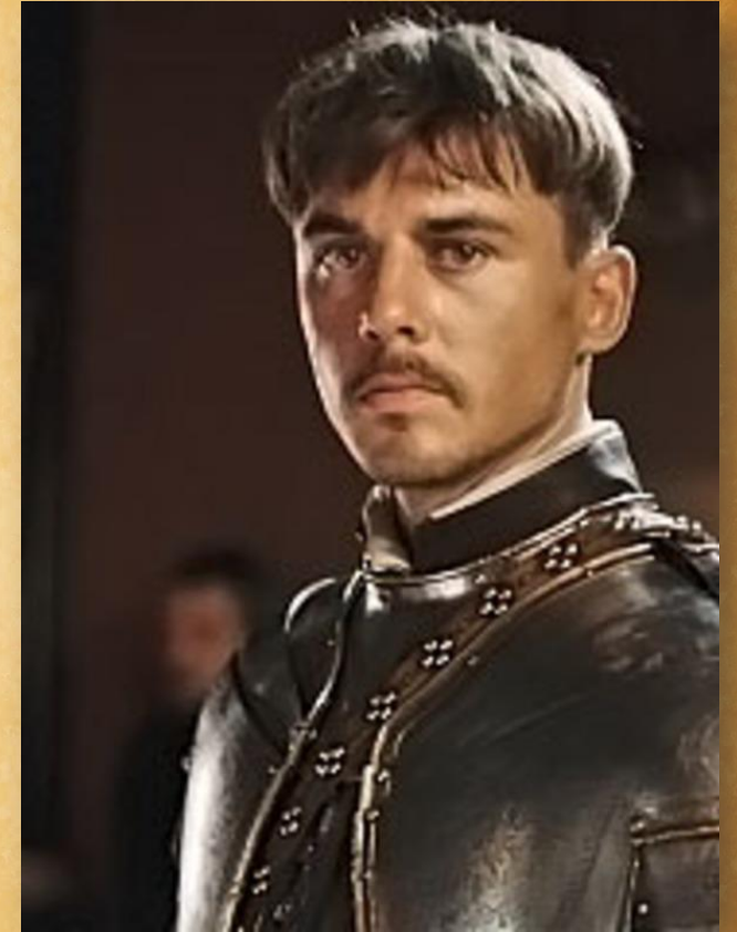
Младший сын -