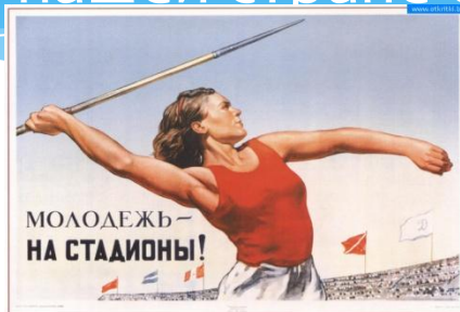
504. Голованов Л. Молодежь — на стадионы! 1947