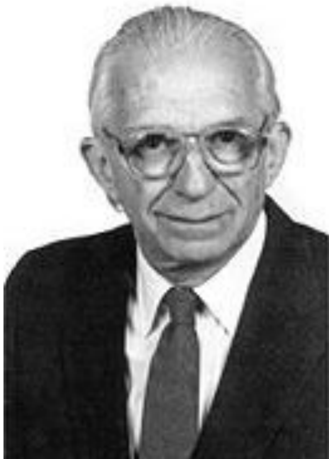
• Уолтер Айзард