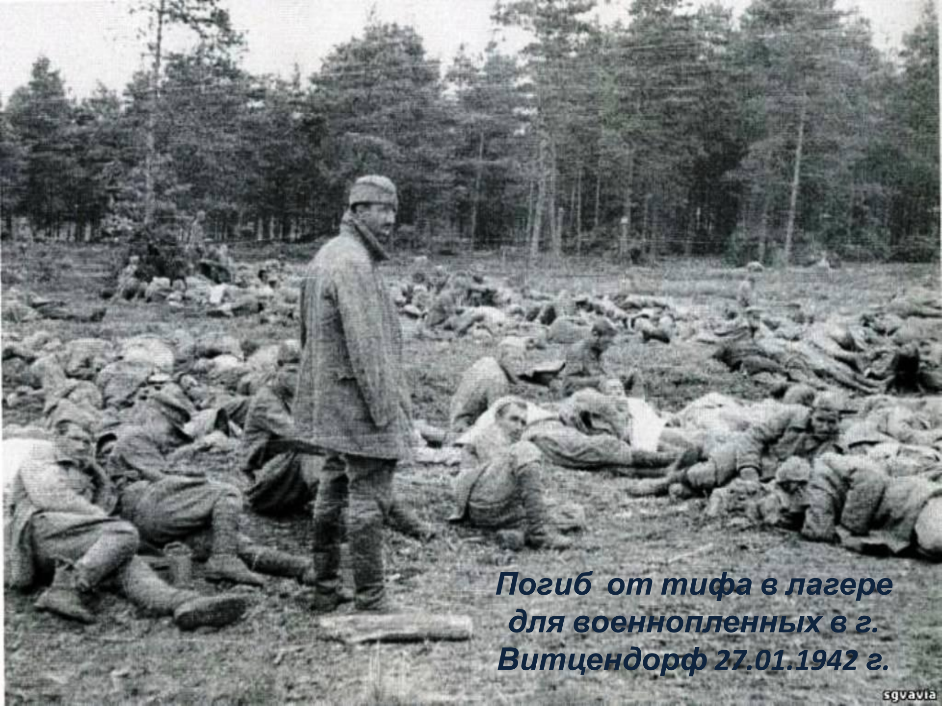
Погиб от тифа в лагере для военнопленных в г. Витцендорф 27.01.1942 г.