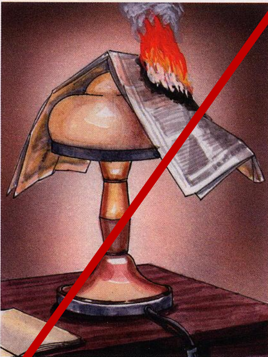
Затемнение электроламп сгораемыми материалами (бумагой, тканью)

8. ЗАПРЕЩАЕТСЯ накрывать электролампы и светильники бумагой, тканью и другими горючими материалами, а также эксплуатировать светильники со снятыми колпаками (рассеивателями), предусмотренными конструкцией светильника.