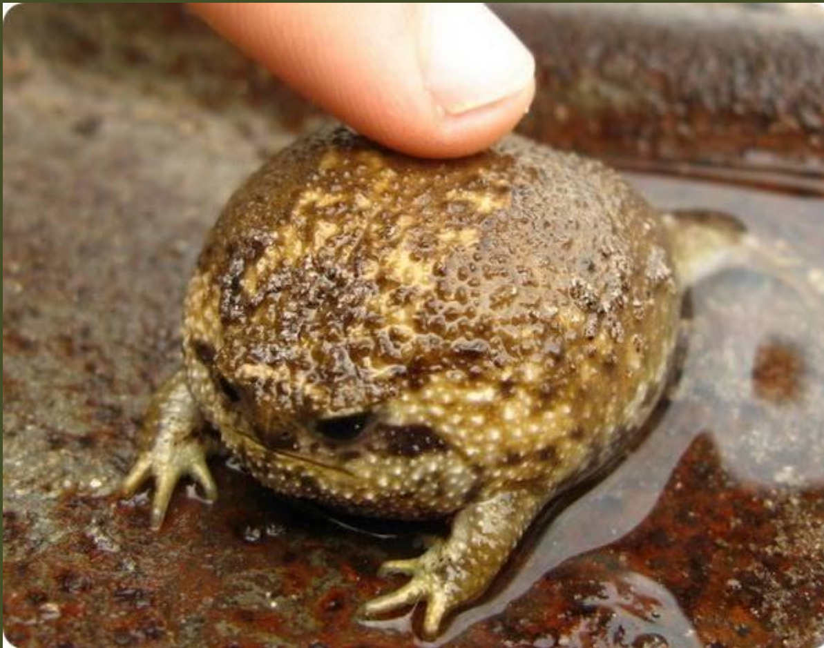
Угрюмая лягушка или африканский узкорот