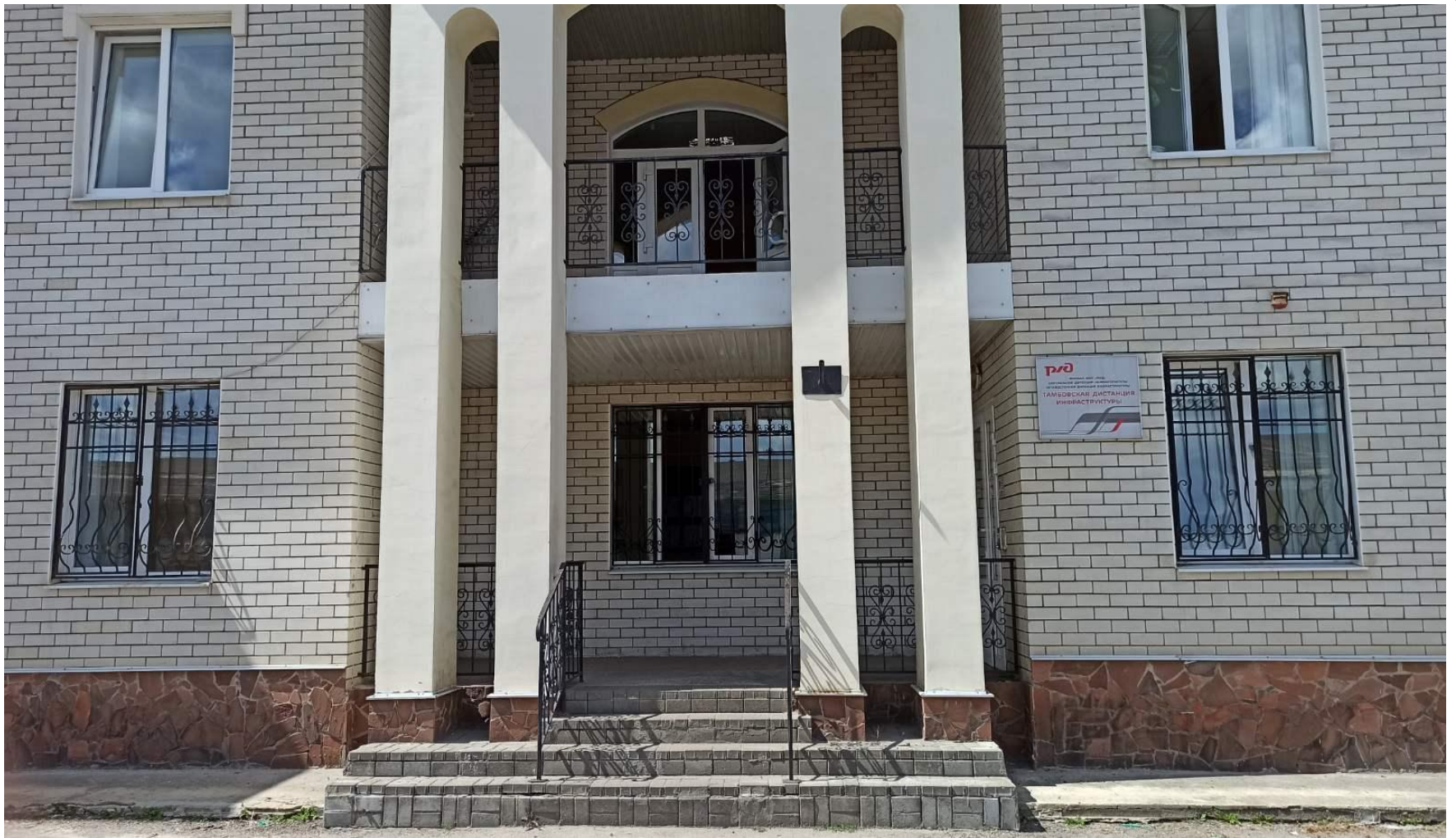
Тамбовская дистанция инфраструктуры – структурное подразделение Юго-Восточной дирекции инфраструктуры ОАО «РЖД»