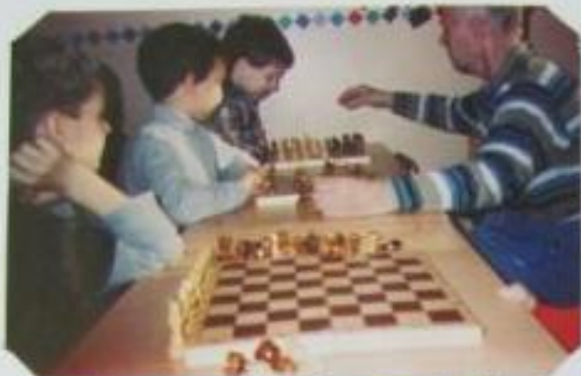
ФРАГМЕНТ ЗАНЯТИЯ В ТД "ШАХМАТЫ" СЯНО ОДНОВРЕМЕННОЙ ИГРЫ НА 3-х ДОСКАХ.

• ФИЗИЧЕСКАЯ - ПРИБЛИЖИТЬ ДЕТЕЙ ДОШКОЛЬНОГО ВОЗРАСТА К ПОСТОЯННЫМ ЗАНЯТИЯМ ФИЗИКУРОЙ, СПОРТОМ И ЕЖЕДНЕВНОЙ ЗАКАЗКЕ.