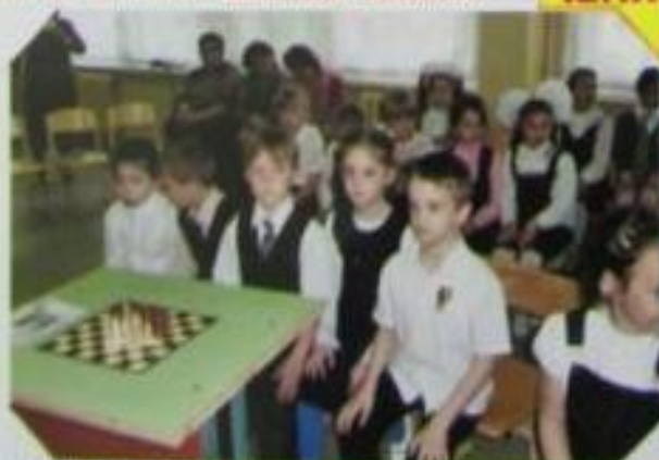
ИНИЦИАТ ИВНИК ТУРНИРА КОМАНД „КОСЛЕДЫ“, „КОМАНДА И ШИАНЦЫ“, „ЗНАКИ“ Готовность № 4