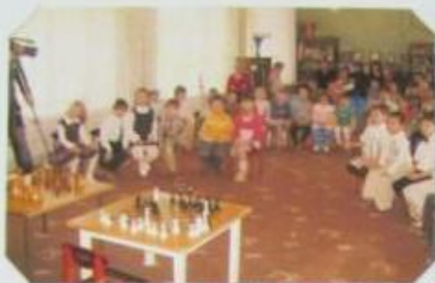
ШАХМАТНОЕ РАЗМИНКА УЧАСТНИКОВ ПРАЗДНИКА.