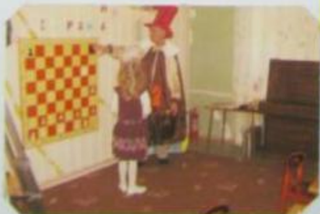
АНЖИЕРА ВАКА ВЫПОЛНИЛА ЗАДАНИЕ: МАТ ЧЕРНОГО КНЯЗЯ В ОДНУ ЛОД. АЛС-КА Ж.