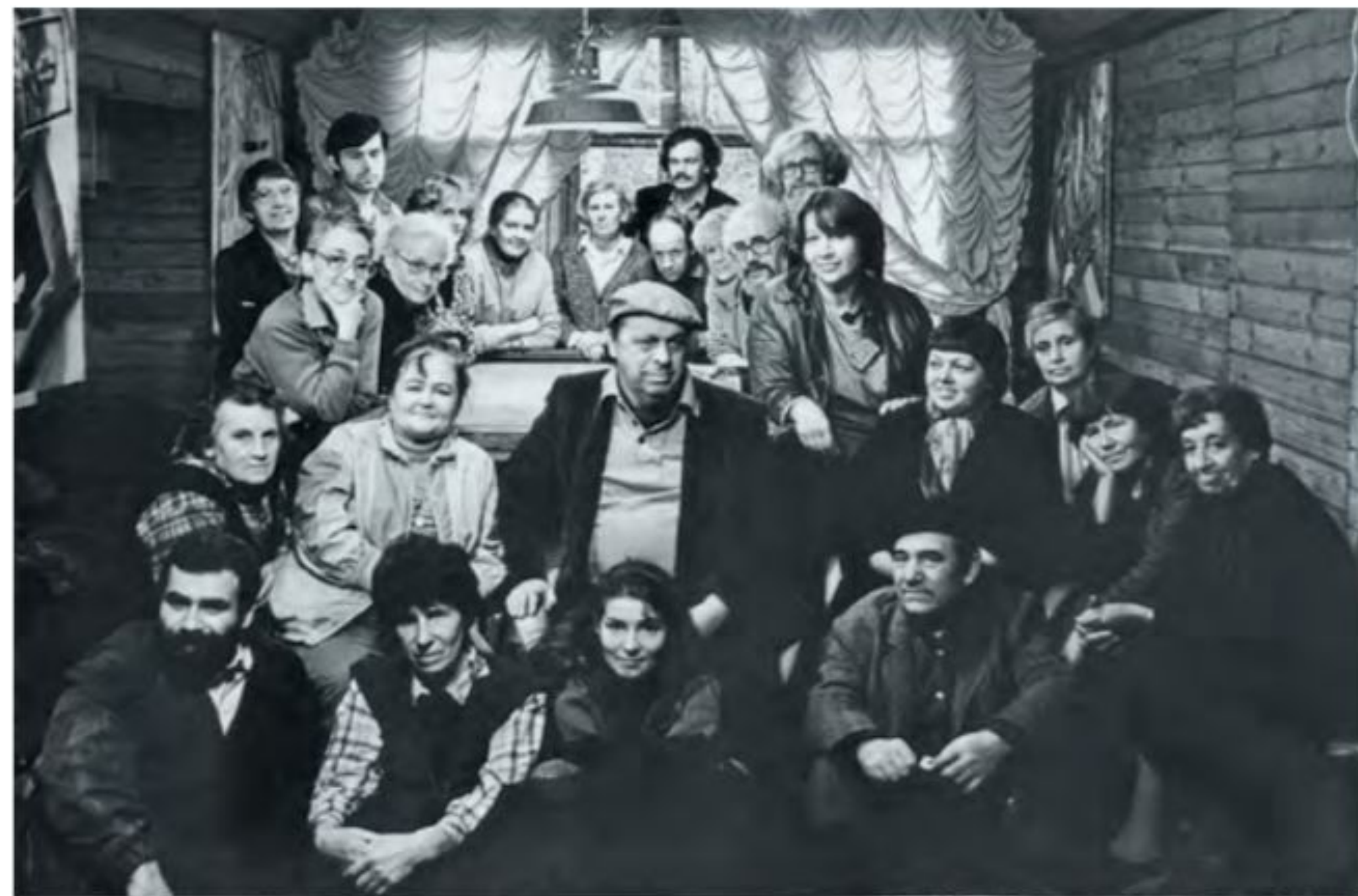
Студия «Новая Реальность», Абрамцево 1989 год.