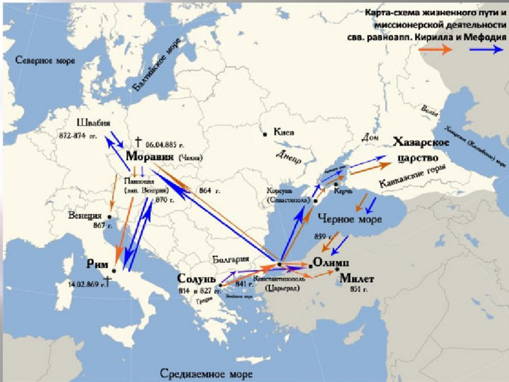
Карта-схема жизненного пути и миссионерской деятельности свв. равноап. Кирилла и Мефодия