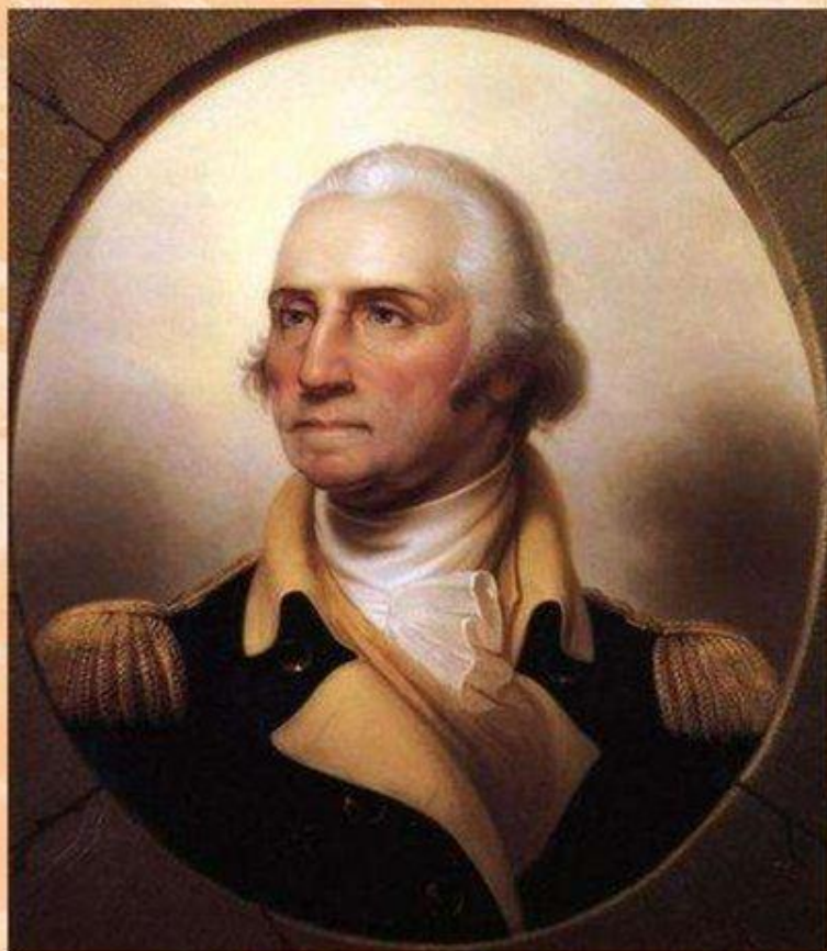
Первый президент Америки (1789-1797)