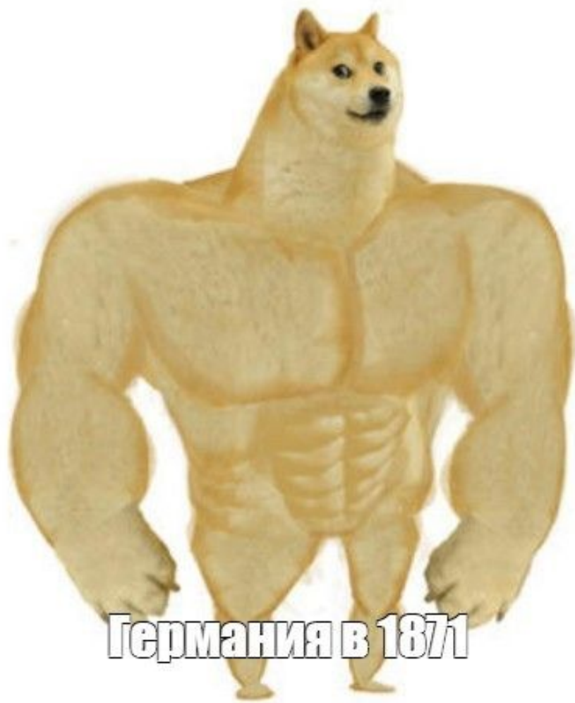
Германия в 1871