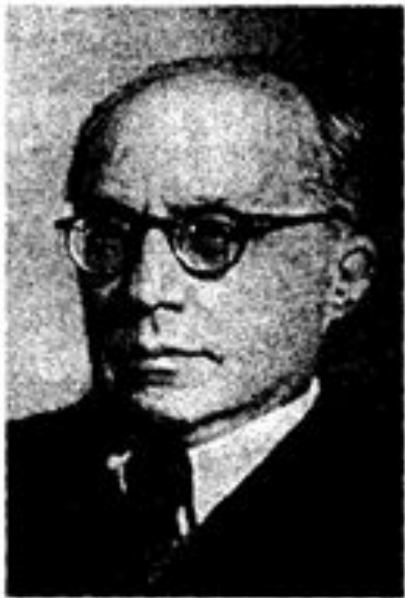
С. Л. Рубинштейн (1889–1960)

«В процессе игры ребенок не просто перевоплощается в чужую личность, но, входя в роль, расширяет, обогащает, углубляет собственную. Управляя игрой детей, можно влиять на их отношения и мировоззрение»