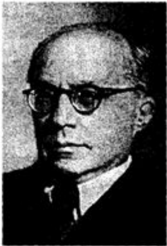
С. Л. Рубинштейн (1889–1960)

«В процессе игры ребенок не просто перевоплощается в чужую личность, но, входя в роль, расширяет, обогащает, углубляет собственную. Управляя игрой детей, можно влиять на их отношения и мировоззрение»