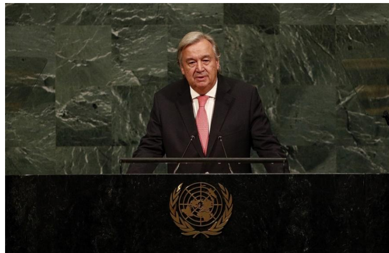
Антониу Гутерриш, генеральный секретарь Организации Объединенных наций