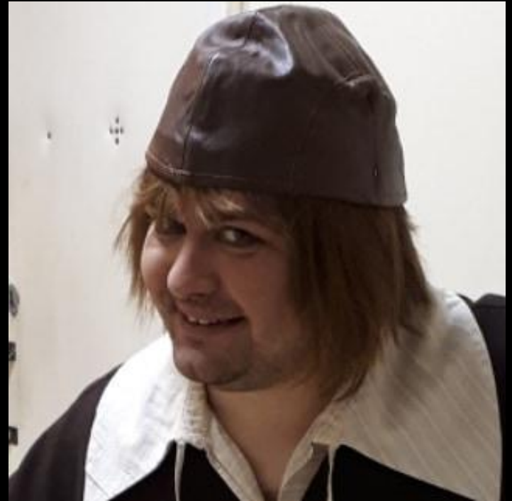
Buffoon – “The Cabal of Hypocrites” by Bulgakov