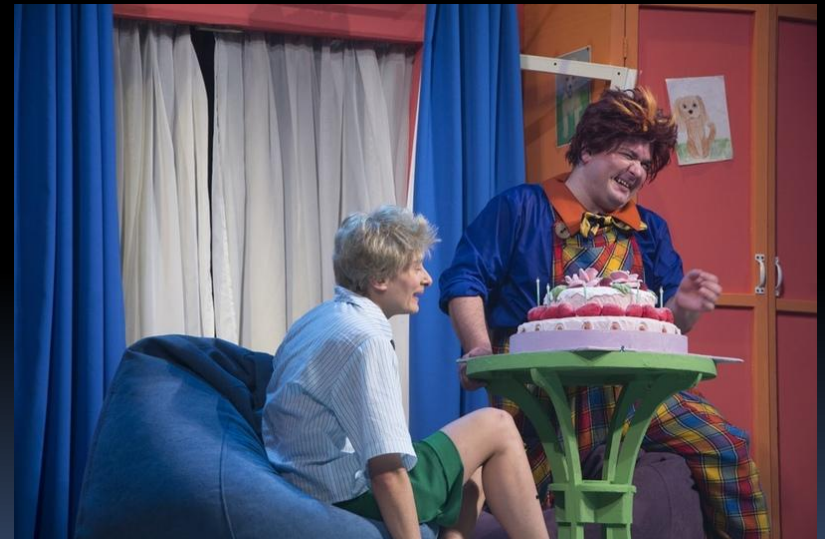
Karlsson – “Kid & Karlsson on the Roof” by Astrid Lindgren