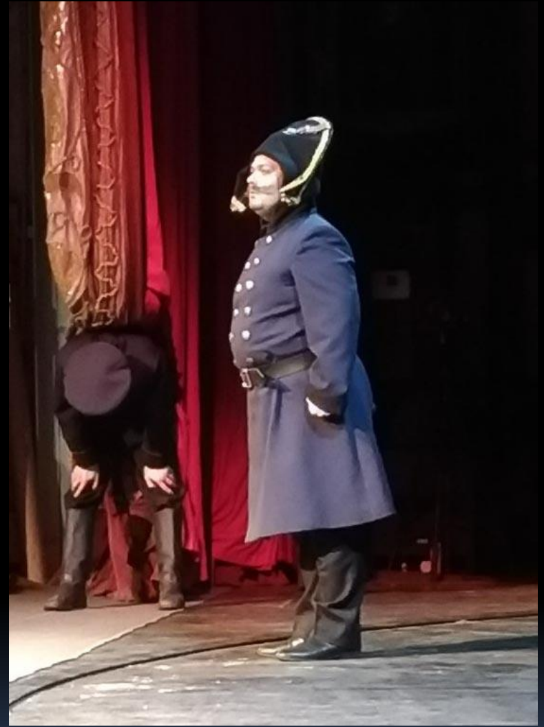
Policeman Uhovertov— “The Government Inspector” by Gogol