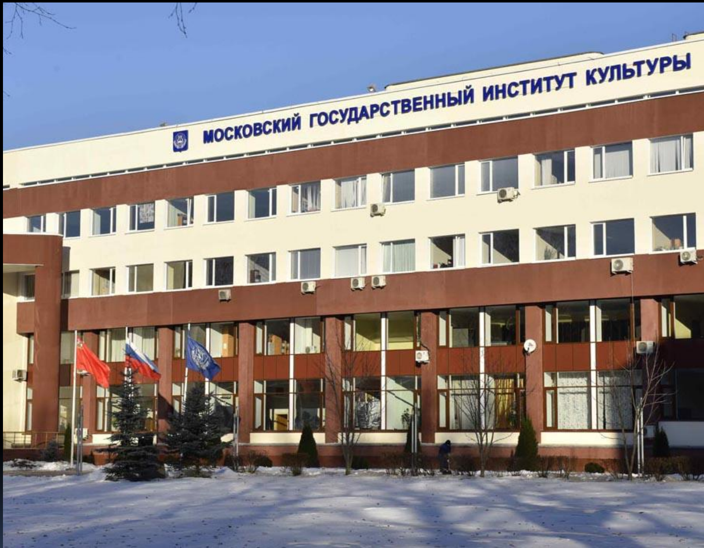
Moscow State Institute of Culture