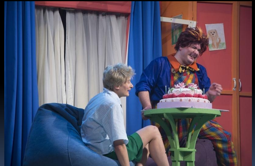
Karlsson – “Kid & Karlsson on the Roof” by Astrid Lindgren