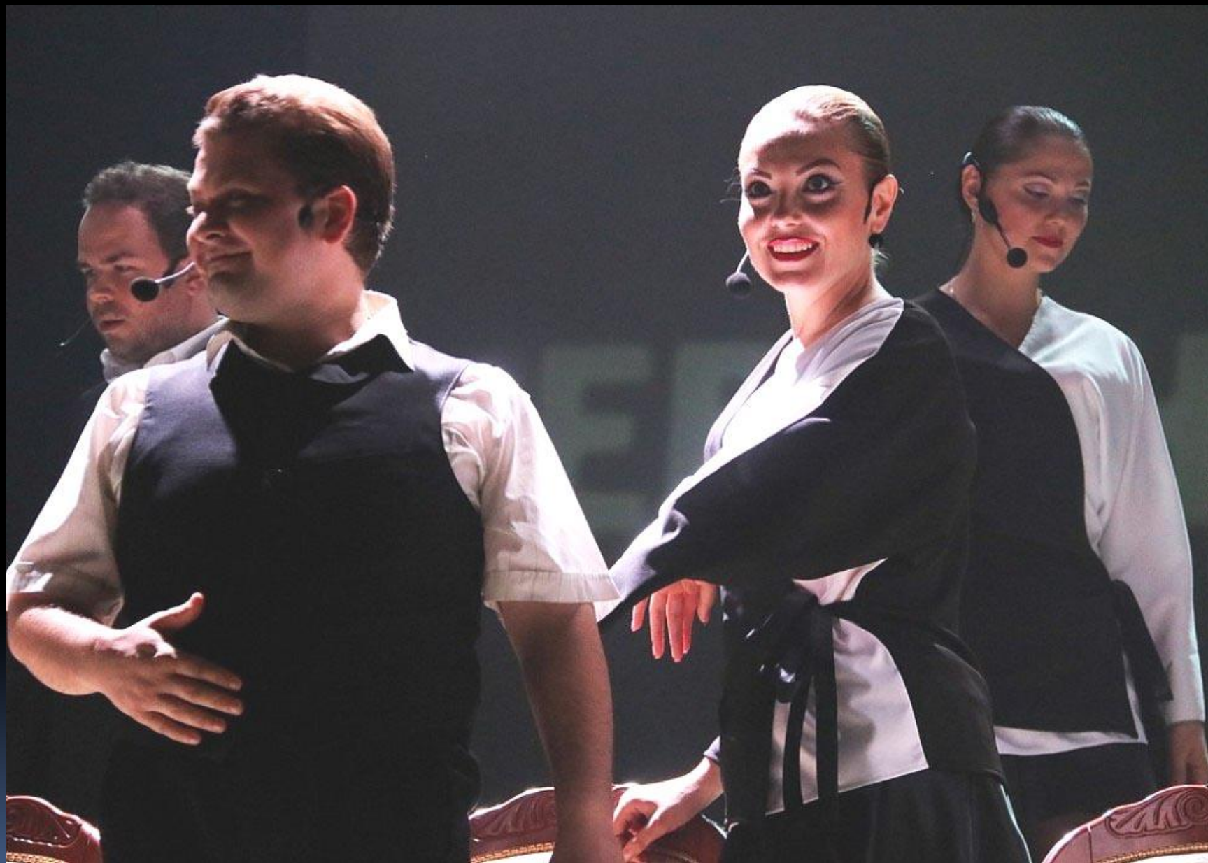
«The Twelve Chairs» by Ilf & Petrov