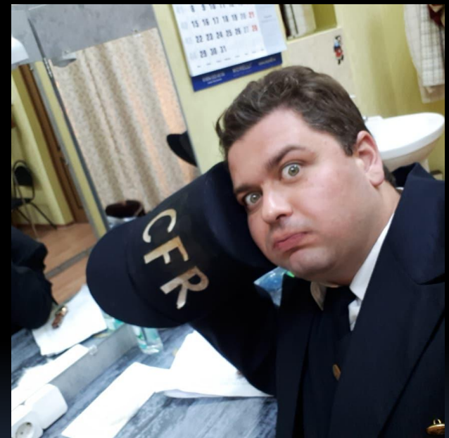
The Head of the station – “Nameless Star” by Mihail Sebastian