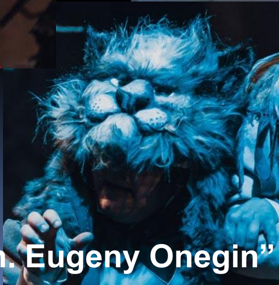
“Pushkin. Eugeny Onegin” by Pushkin