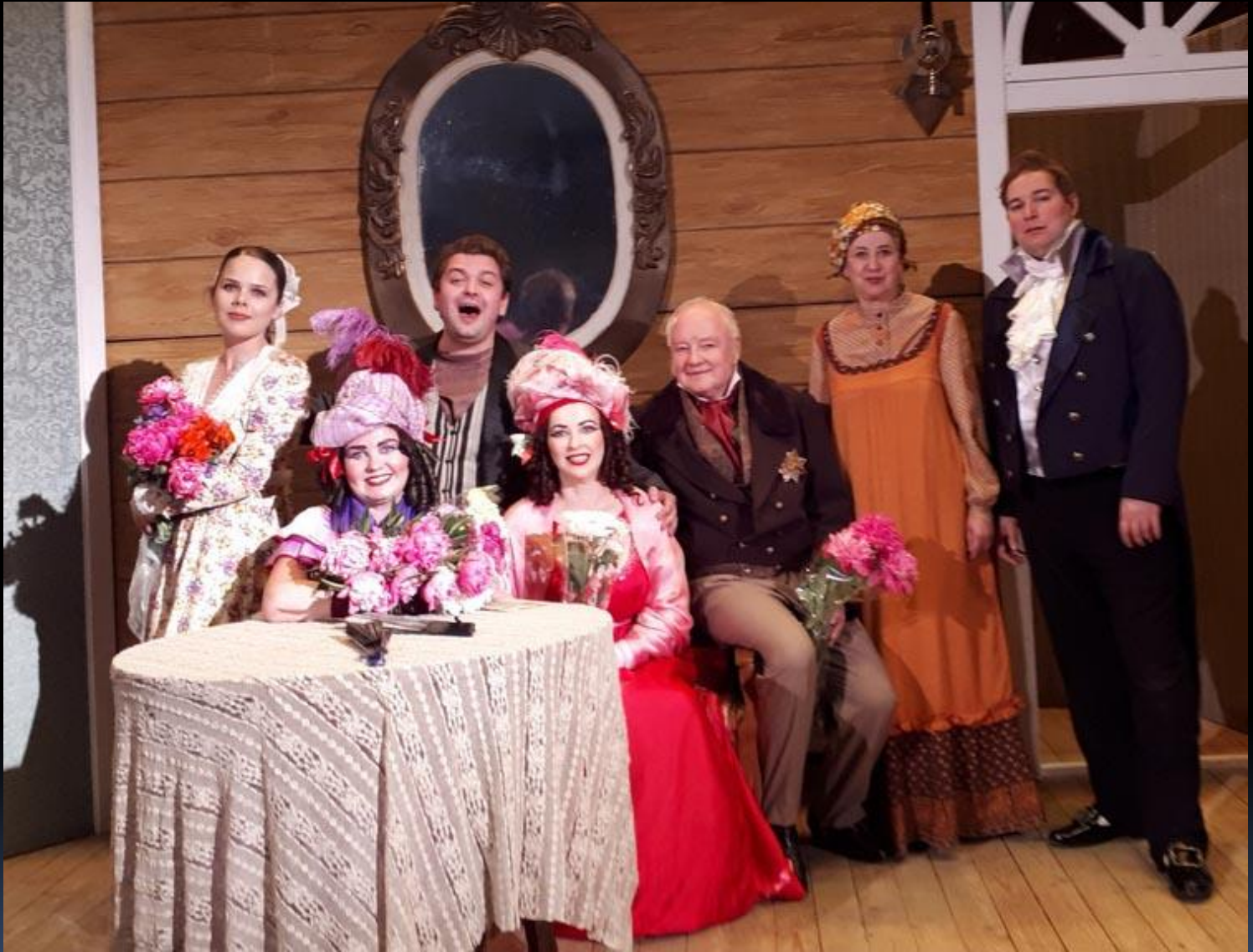
Sidorka – “Lesson for Daughters” by Krylov