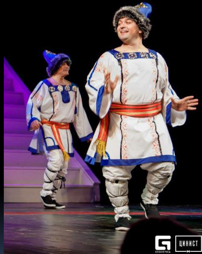
Knight, Boyar, Buffoon — «The Tale of the Dead Princess and the Seven Knights» by Pushkin