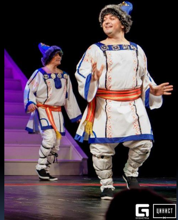
Knight, Boyar, Buffoon — «The Tale of the Dead Princess and the Seven Knights» by Pushkin