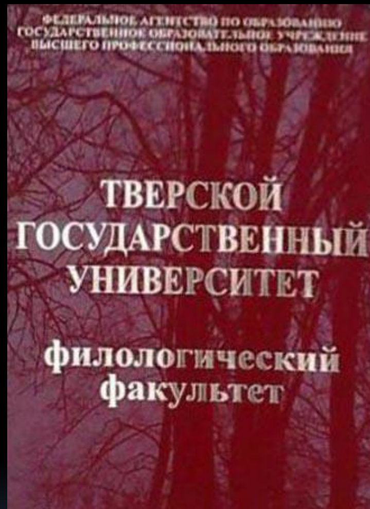
Tver State University