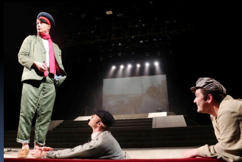
«The Twelve Chairs» by Ilf & Petrov