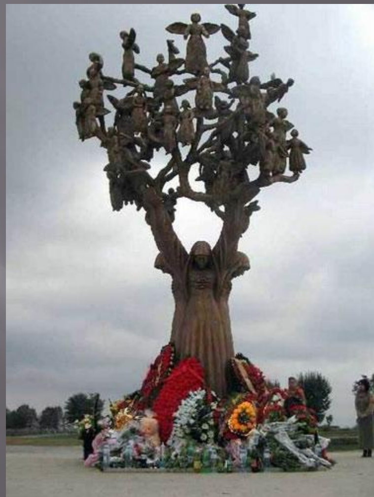
ПАМЯТНИК ДЕТЯМ БЕСЛАНА «Дерево скорби»