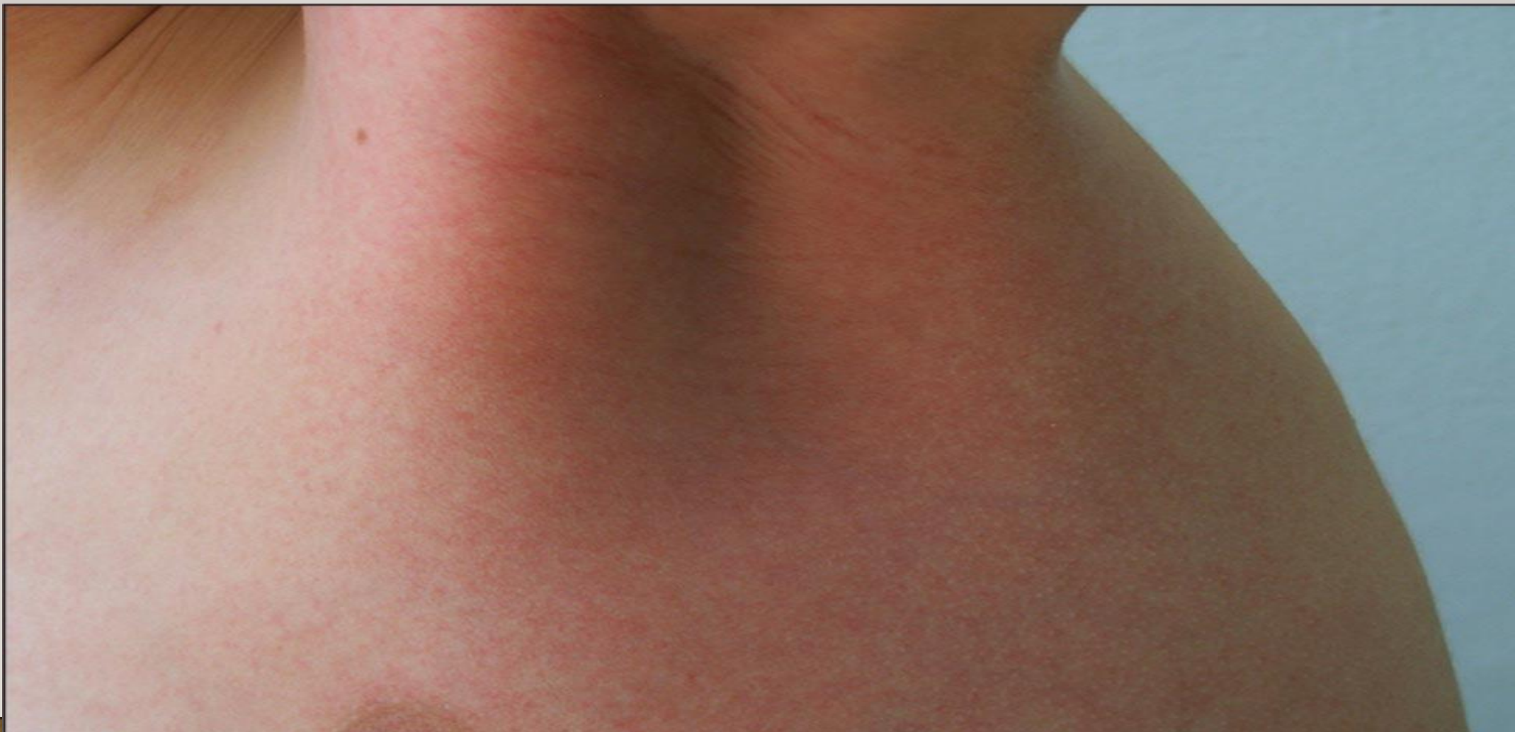
Рисунок 4. Скарлатина. Мелкоточечная сыпь в подмышечной впадине

МЕЛКОТОЧЕЧНАЯ СЫПЬ – сыпь ОКОЛО 1 ММ В ДИАМЕТРЕ. ДАННЫЙ ВИД СЫПИ МОЖЕТ НЕ ВОЗВЫШАТЬСЯ НАД ПОВЕРХНОСТЬЮ КОЖИ ИЛИ НЕМОГО ВОЗВЫШАТЬСЯ НАД ПОВЕРХНОСТЬЮ КОЖИ