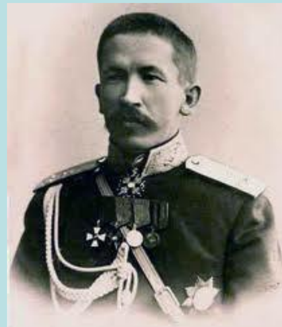
Л. Г. Корнилов

Командующим Добровольческой армией был назначен генерал Л.Г. Корнилов . Гражданская власть оставалась в руках генерала Алексеева .