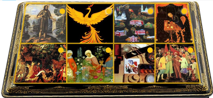
ПАЛЕХСКАЯ ЛАКОВАЯ МИНИАТЮРА