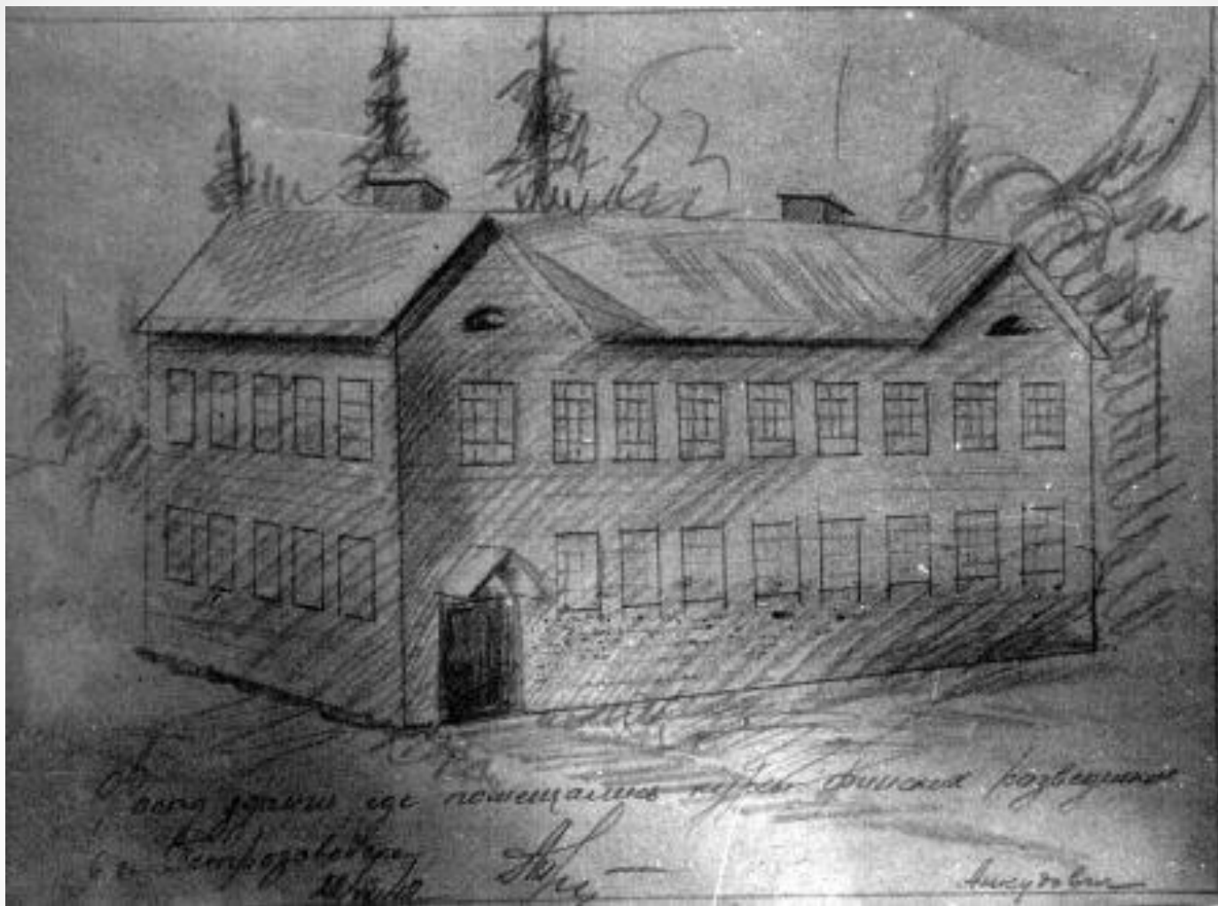
Рисунок здания Петрозаводской разведшколы, Автор - курсант А.В. Анкудович, июль 1942 г.