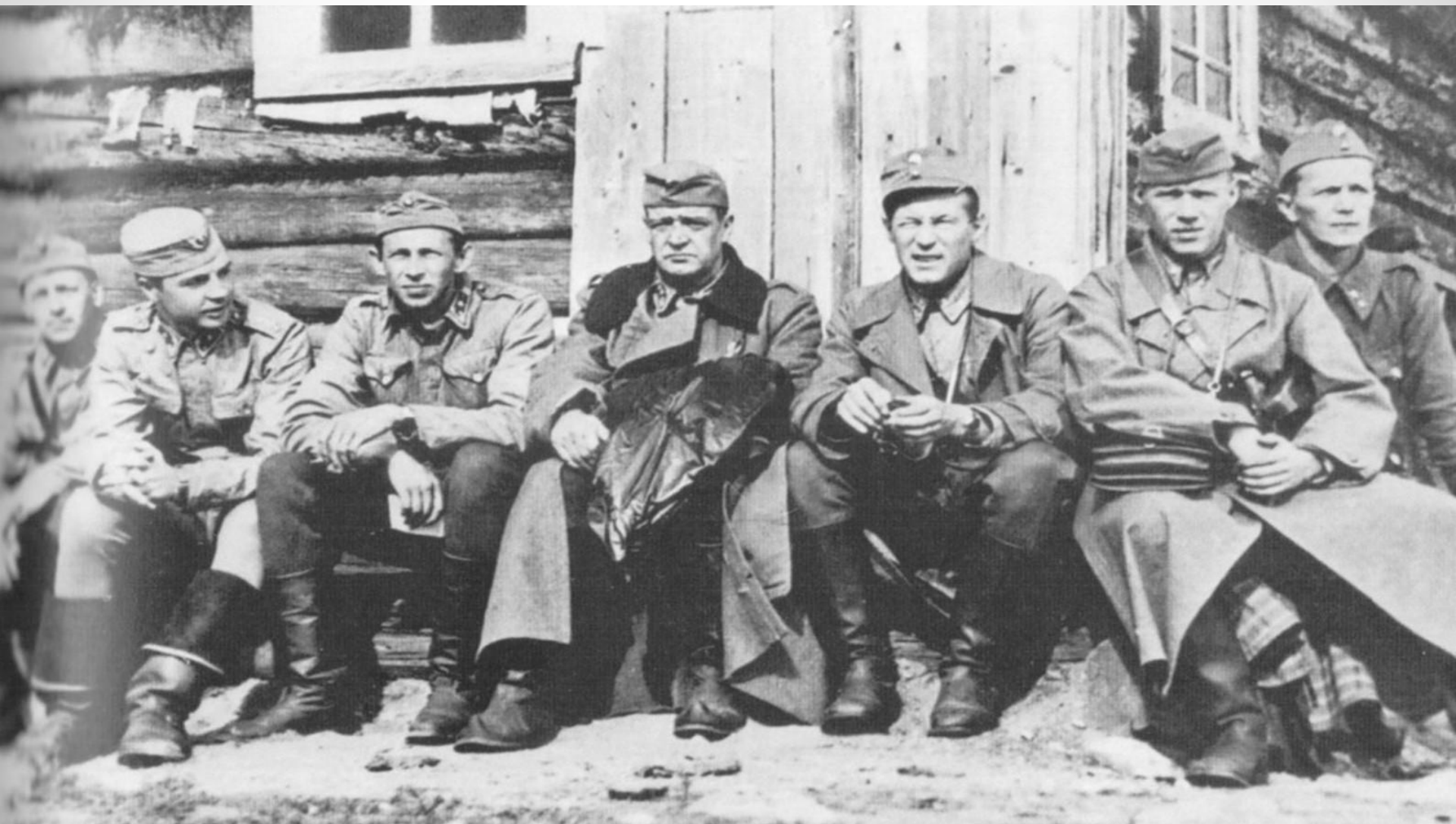
Os. Raski officers.