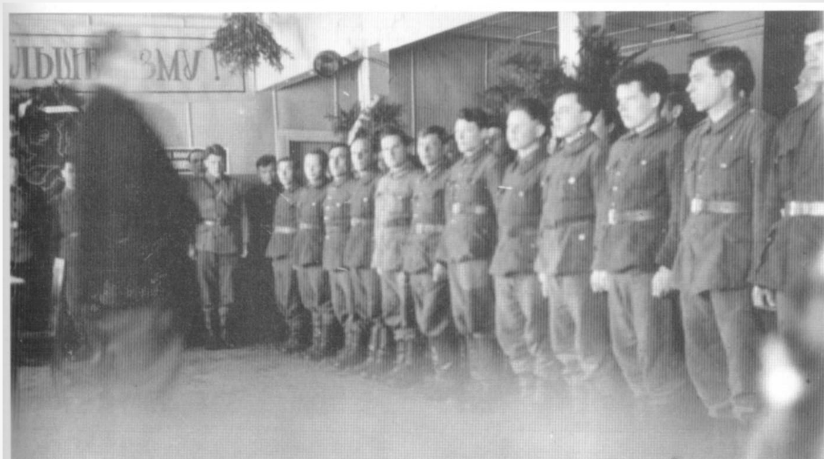
Курсанты Петрозаводской школы финской разведки