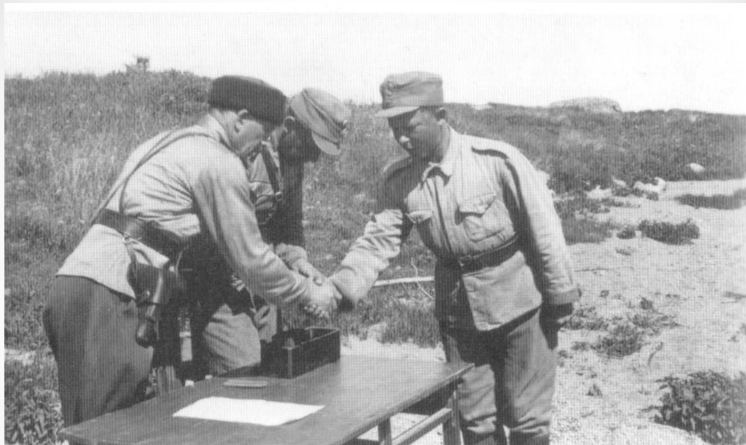
Церемония награждения курсантов Петрозаводской школы финской разведки, 1943 г., берег оз. Шотозеро.