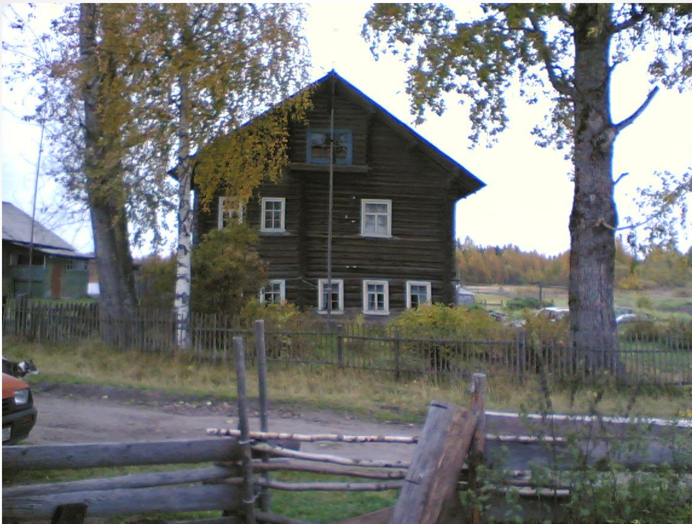
Дом в Улялеге, в котором располагалась Петрозаводская разведшкола в 1942-1943 гг.