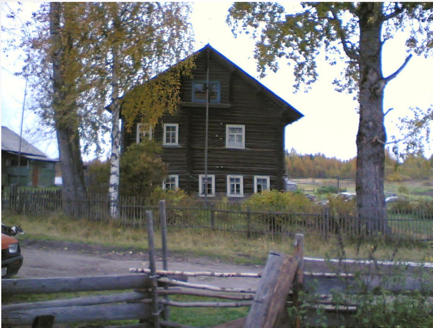
Дом в Уляге, в котором располагалась Петрозаводская разведшкола в 1942-1943 гг.