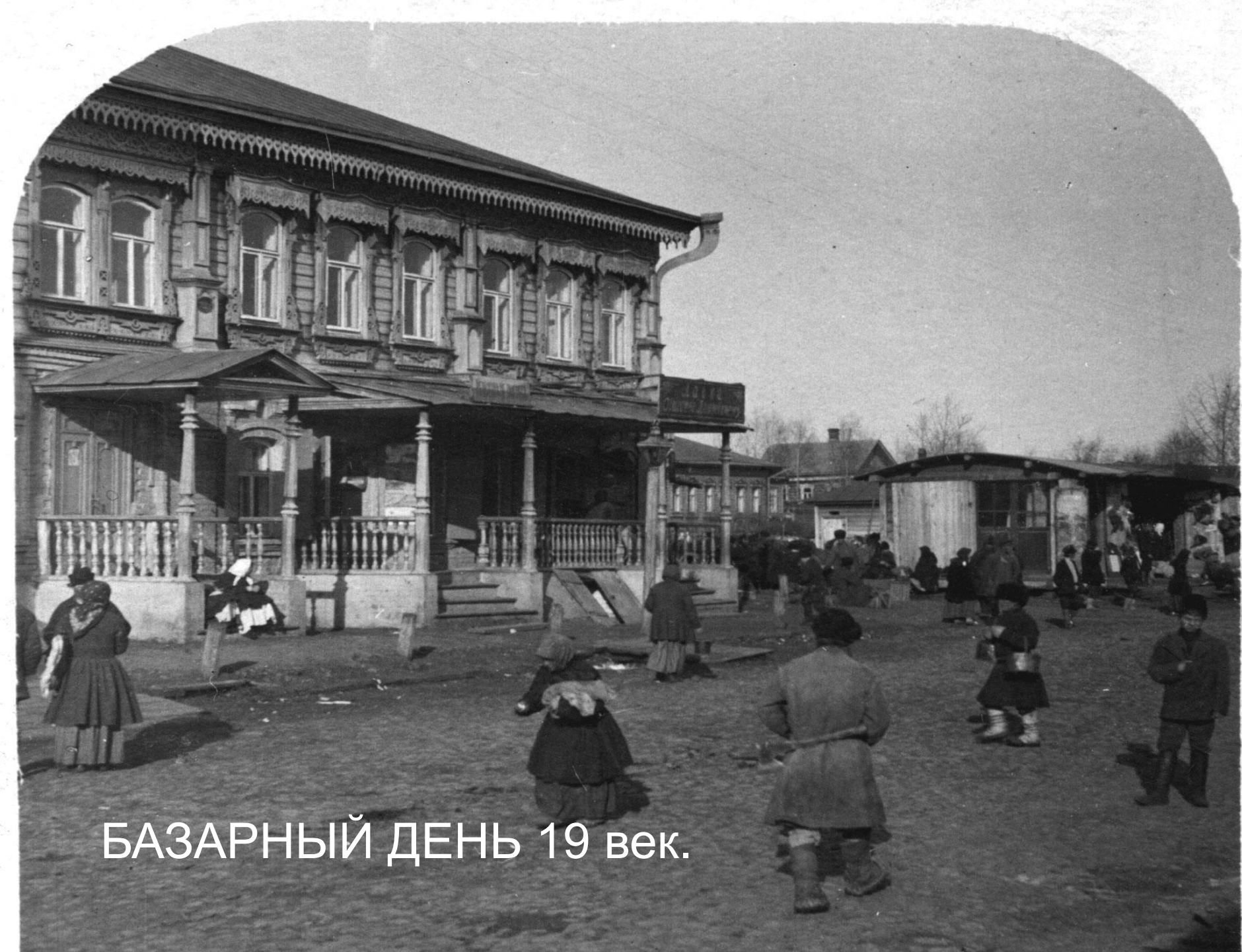
БАЗАРНЫЙ ДЕНЬ 19 век.