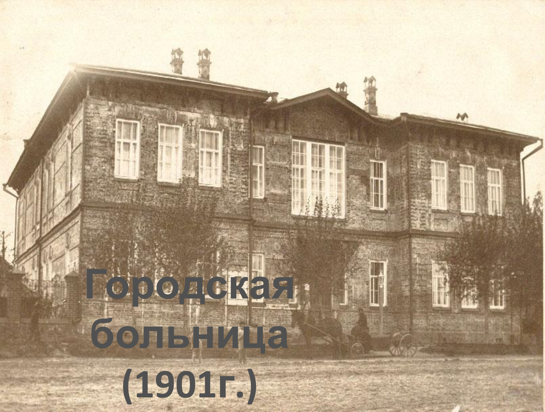
Городская больница (1901г.)