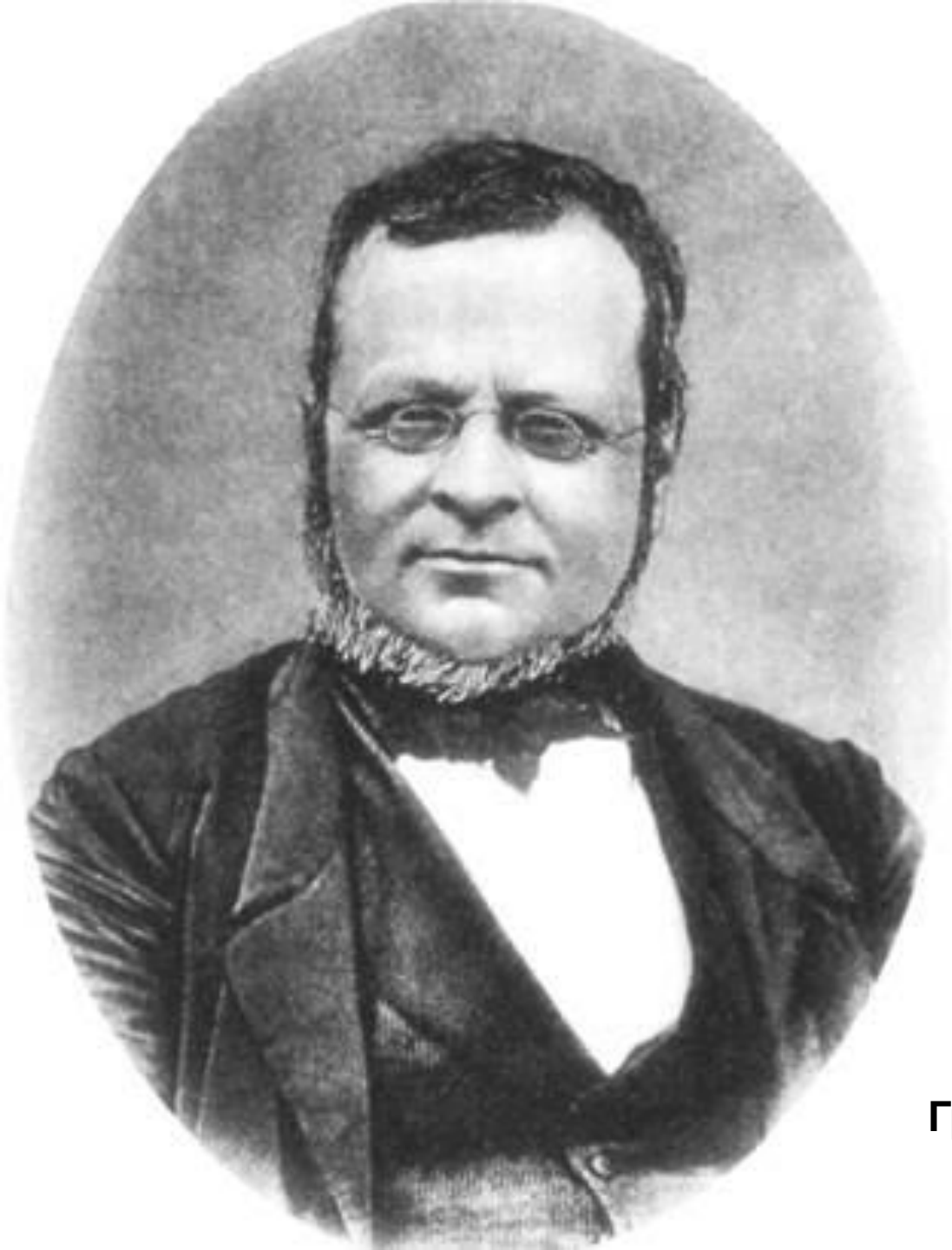
Граф Камилло Бенсо Кавур (1810 – 1861 гг.)