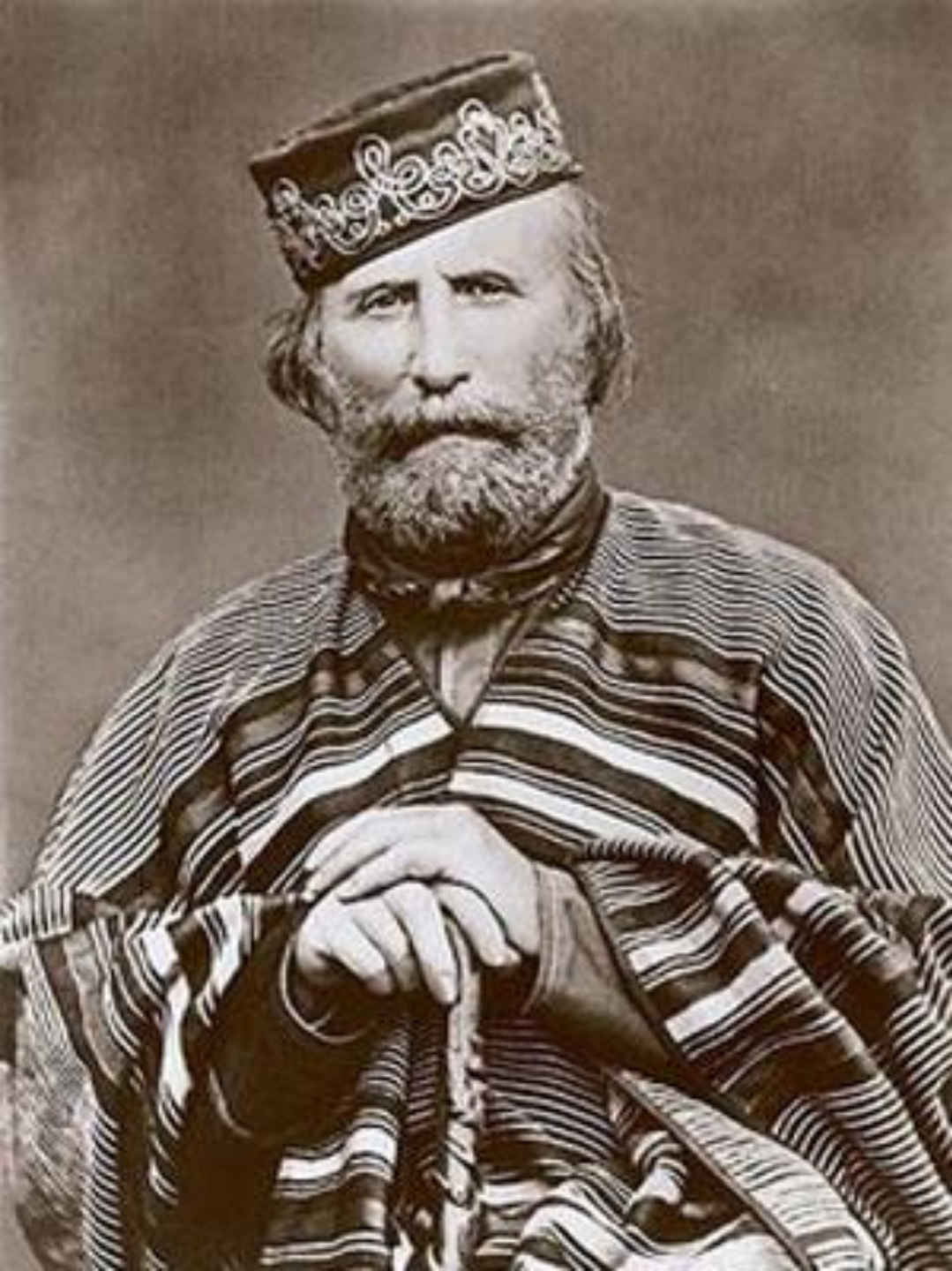
Д. Гарибальди (1807 – 1882 гг.)