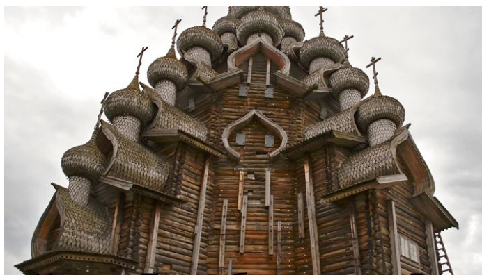
Храм Преображения Господня. Кижы. Россия