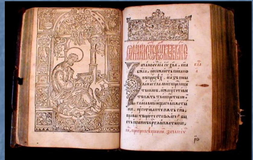
Орнамент на поле одной из страниц рукописи. Слова Григория Богослова 80 - 90-е годы XV в.