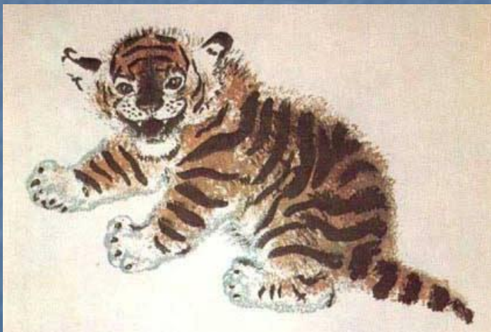
Е. Чарушин. Иллюстрация к книге С.Я. Маршака «Детки в клетке»

На иллюстрациях можно увидеть героев книг, место, где происходят события.