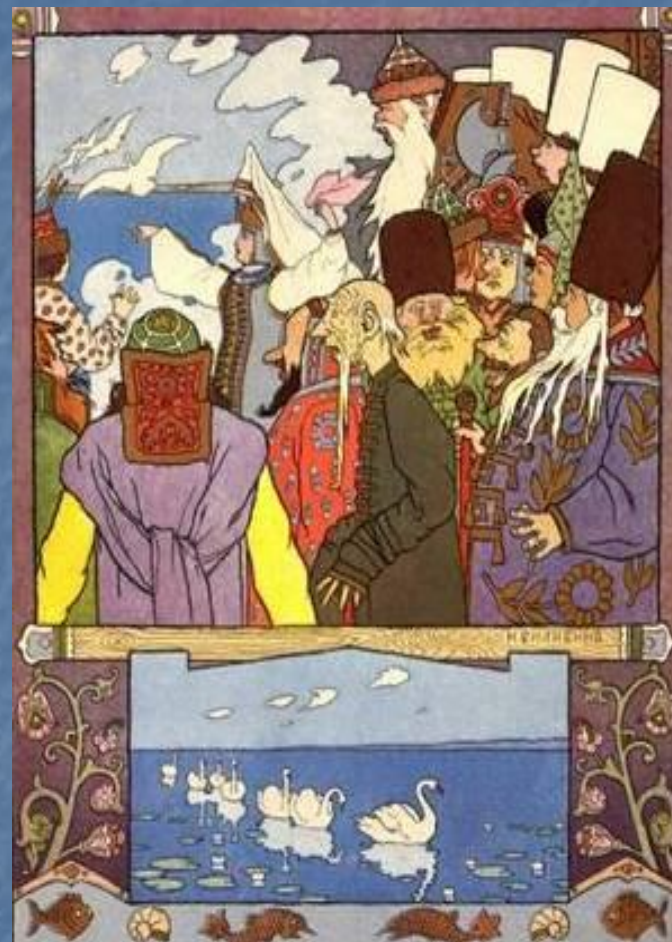
И. Билибин. Иллюстрация к сказке «Царевна-лягушка»