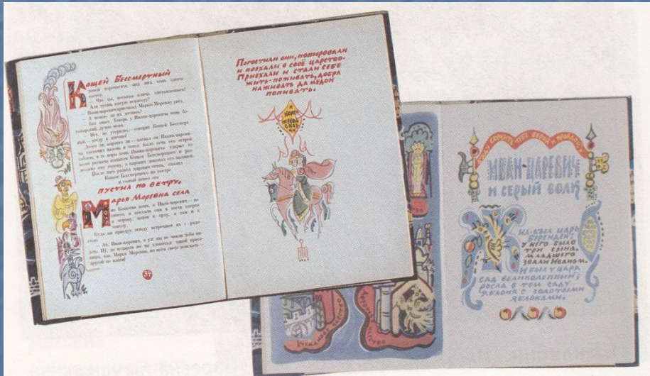
Украшения в детских книгах. Русские народные сказки.

Книги богато украшались с древних времён. Книга всегда была величайшей драгоценностью.