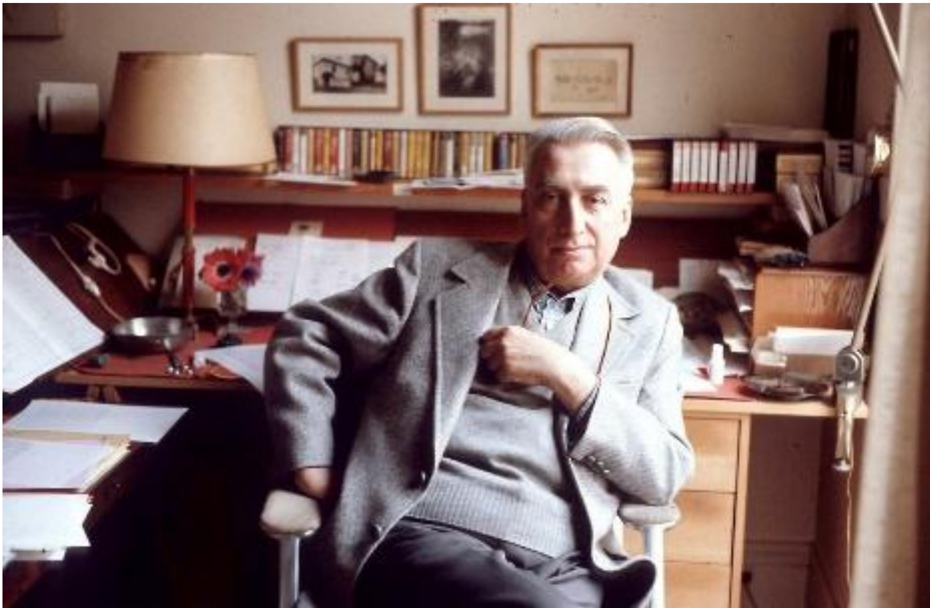
Р. Барт 1915-1980