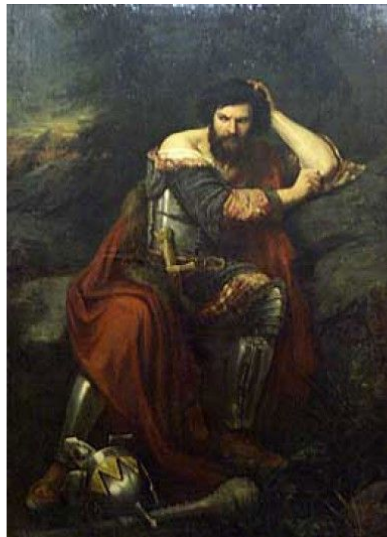
В.В.Шереметев. Святополк Окаянный.