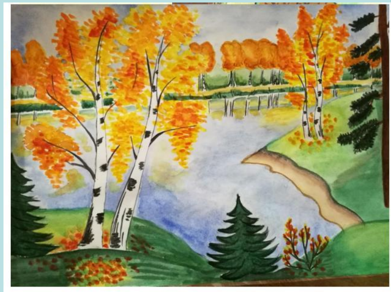
Пример работы: «Лес»