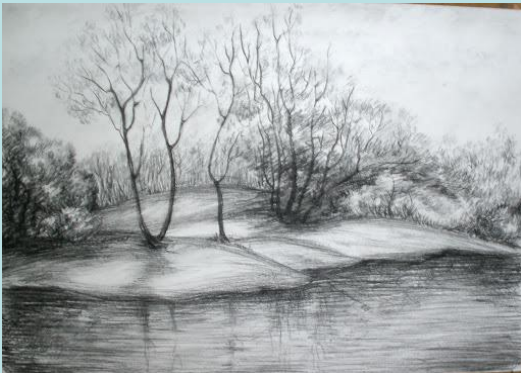
Пример работы: «Графика»