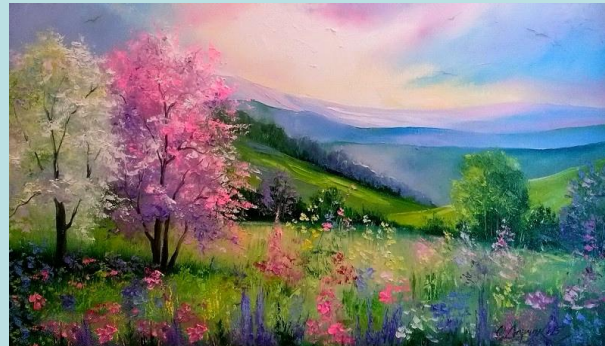
Пример работы: «Пейзаж»