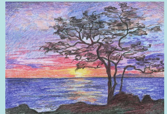
Пример работы: «Цветная графика»