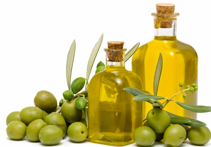
EL ACEITE DE OLIVA