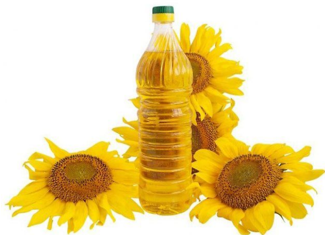
EL ACEITE DE GIRASOL