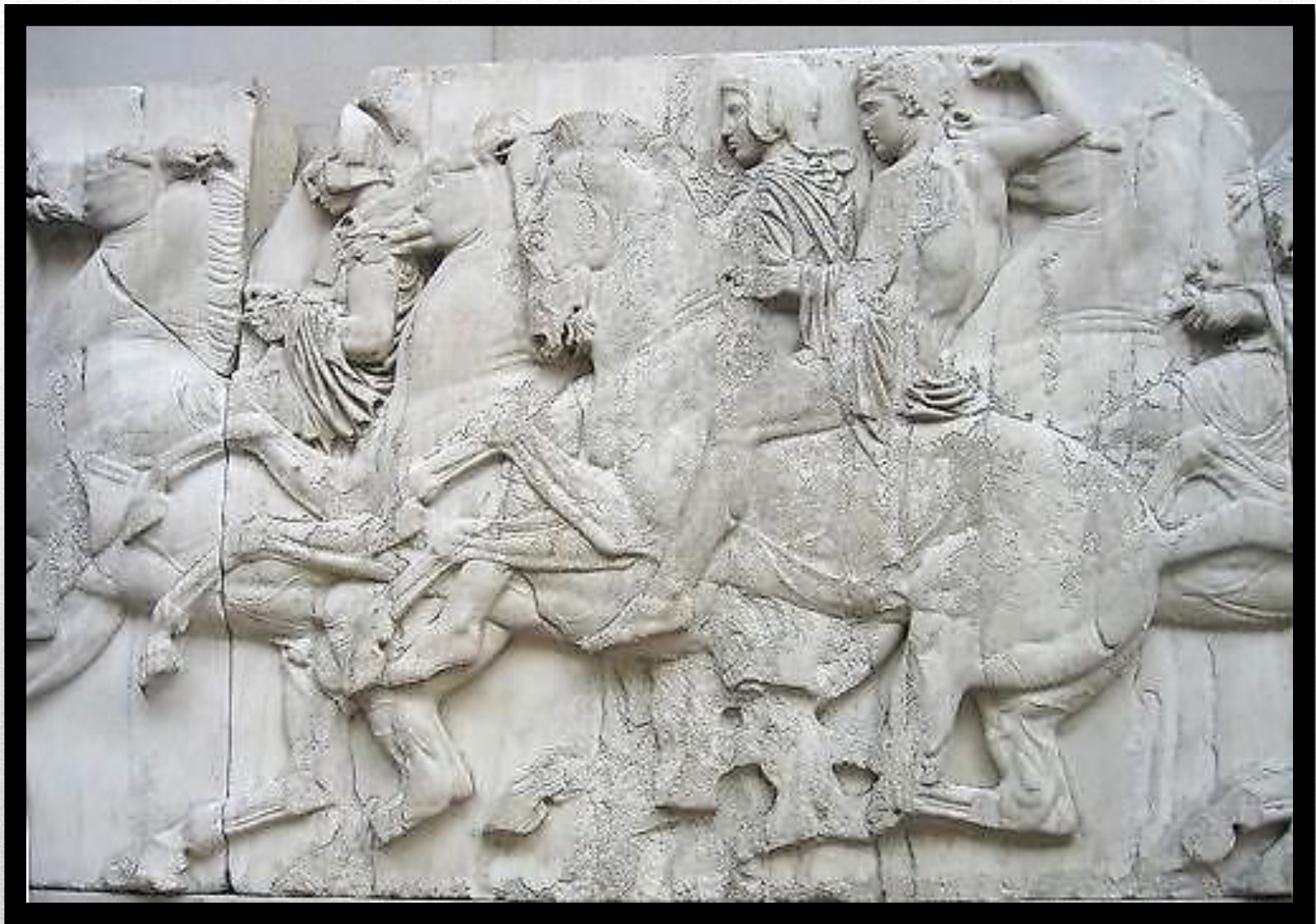
Древняя Греция Парфенон