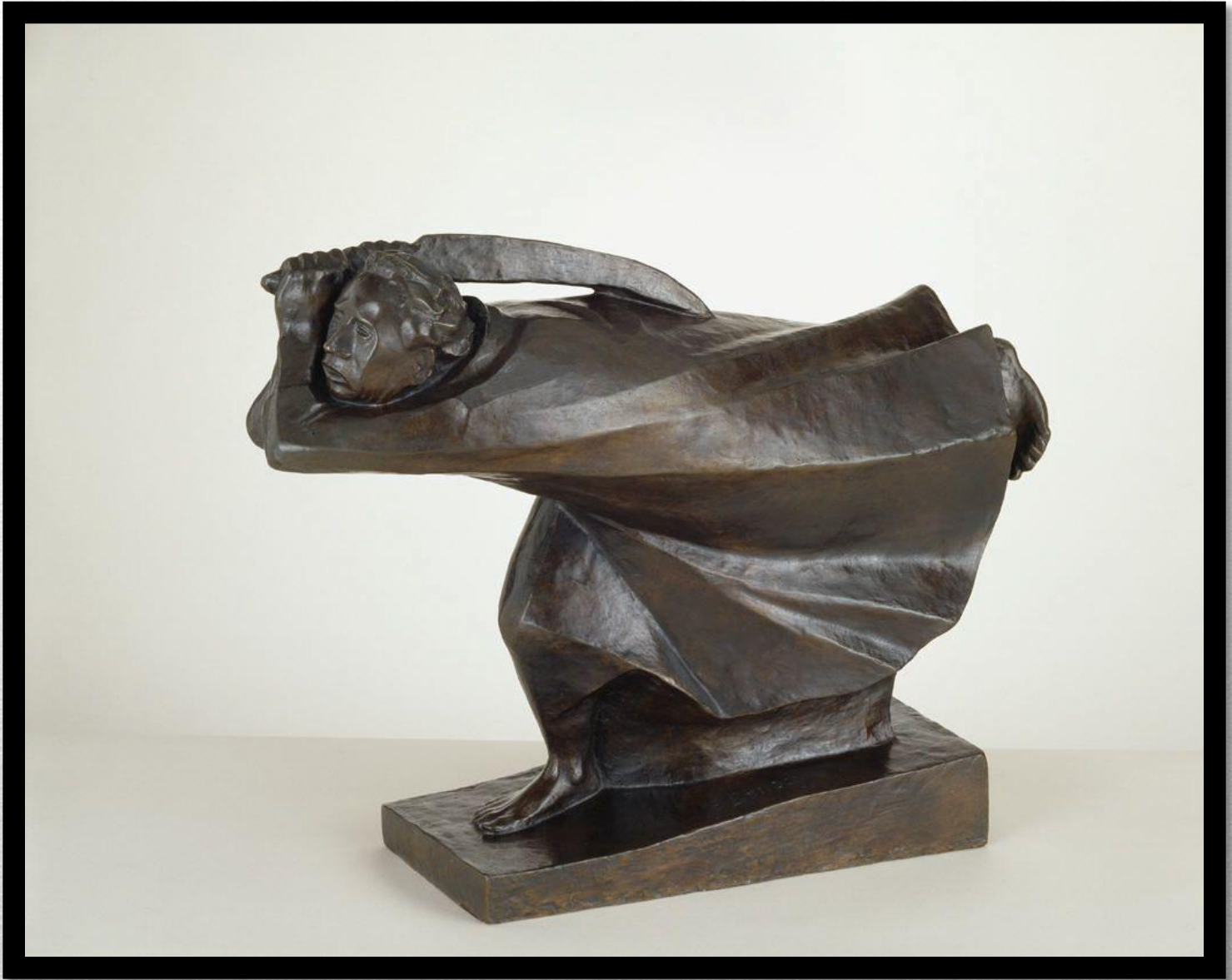
Скульптура Эрнст Барлах