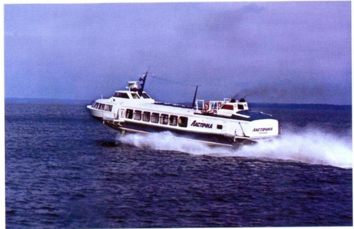
СПК «Ласточка». Фото А. А. Беляева