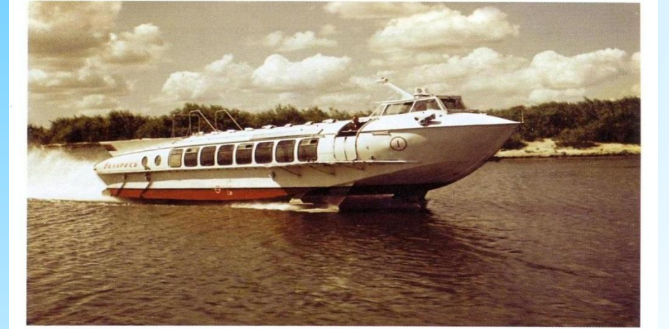
СПК «Беларусь».