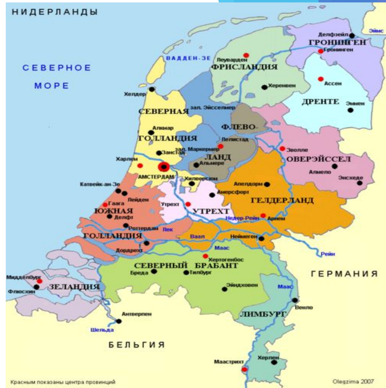
Рис. 2 Административное деление Нидерландов на провинции

▶ Распространён главным образом в провинции Фрисландия в Нидерландах, включая Западно-Фризские острова Терсхеллинг и Схирмонниког (около 350 тыс. чел.)