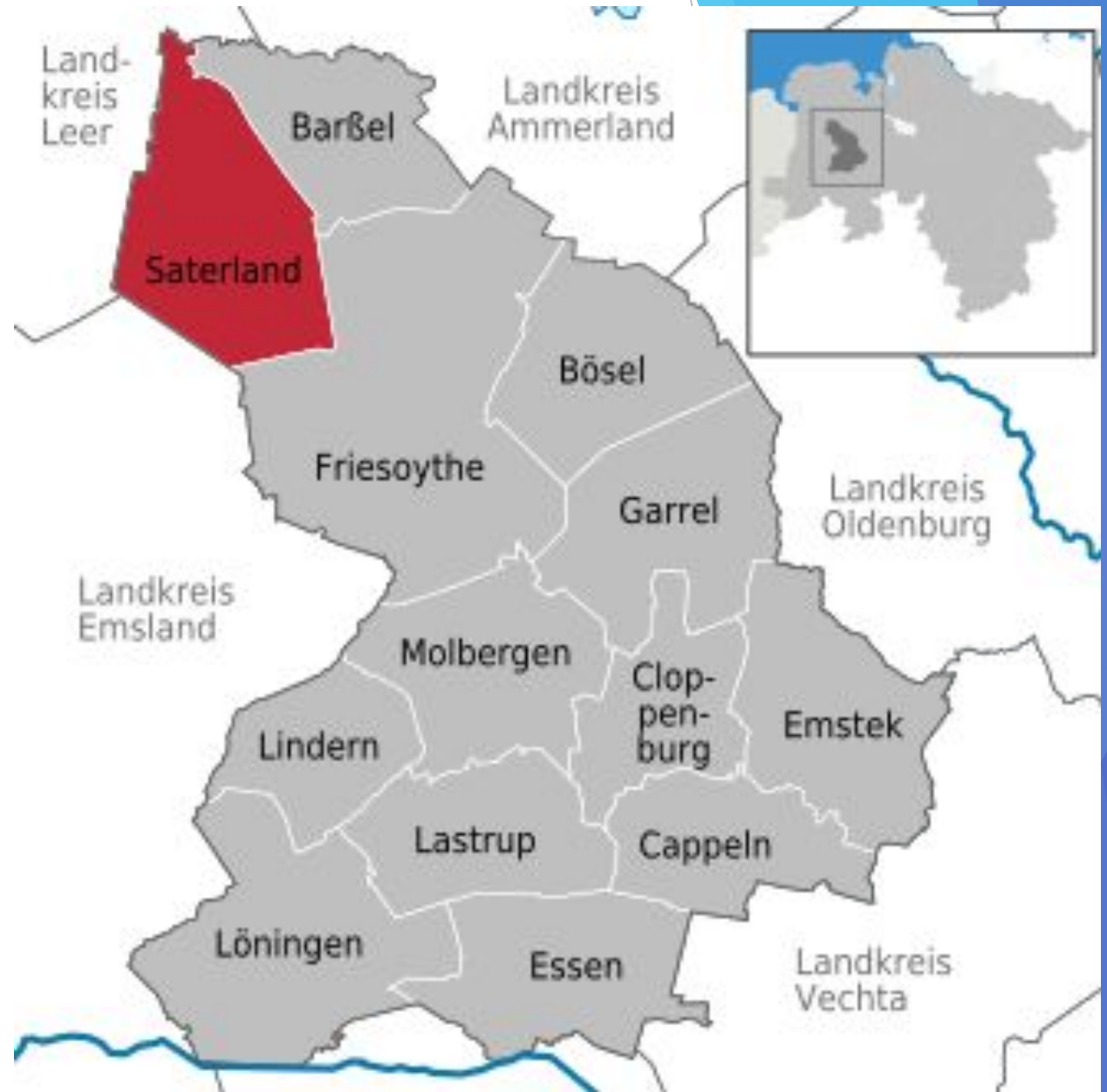
Рис.3 Затерланд на карте