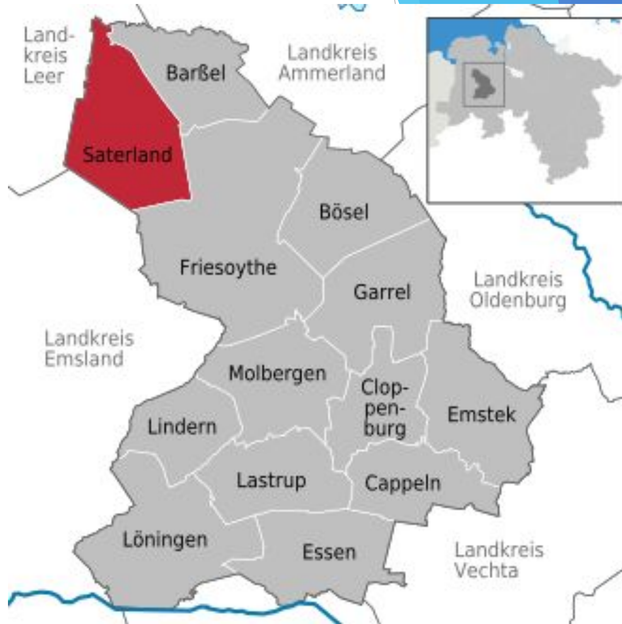
Рис.3 Затерланд на карте