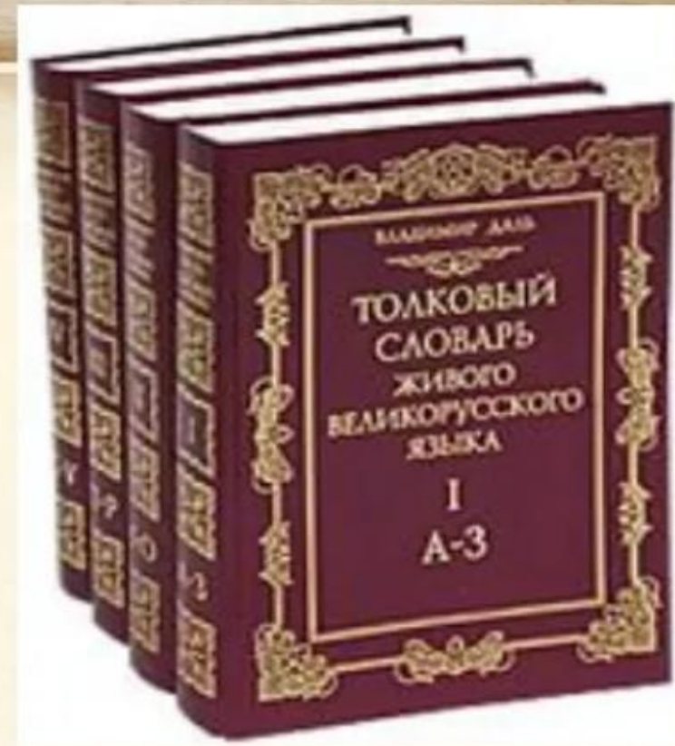
Толковый словарь живого великорусского языка