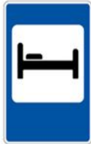
7.9 ГОСТИНИЦА ИЛИ МОТЕЛЬ