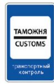
7.14.1 ПУНКТ ТАМОЖЕННОГО КОНТРОЛЯ