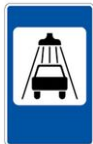
7.5 МОЙКА АВТОМОБИЛЕЙ