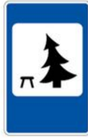
7.11 МЕСТО ОТДЫХА