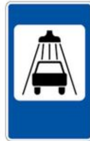
7.5 МОЙКА АВТОМОБИЛЕЙ