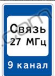
7.16 ЗОНА РАДИОСВЯЗИ САВАРИЙНЫМИ СЛУЖБАМИ