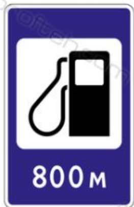
7.3 Автозаправочная станция