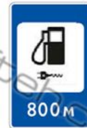
7.21 АВТОЗАПРАВочная СТАНЦИЯ С ВОЗМОЖНОСТЬЮ ЗАРядКИ ЭЛЕКТРОМОБИЛЕЙ 800 м