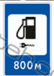
7.21 АВТОЗАПРАВочная СТАНЦИЯ С ВОЗМОЖНОСТЬЮ ЗАРЯДКИ ЭЛЕКТРОМОБИЛЕЙ