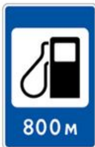
7.3 АВТОЗАПРАВочная СТАНЦИЯ