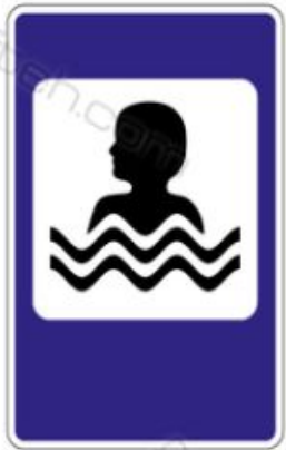
7.17 Бассейн или пляж