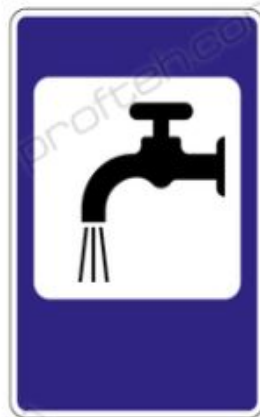
7.8 Питьевая вода