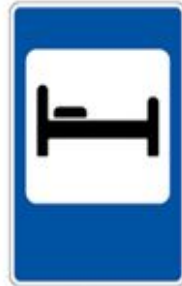
7.9 ГОСТИНИЦА ИЛИ МОТЕЛЬ