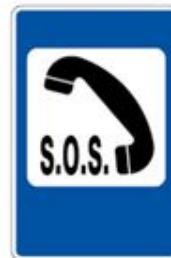
7.19 ТЕЛЕФОН ЭКСТРЕННОЙ СВЯЗИ