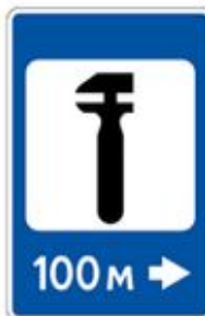
7.4 ТЕХНИЧЕСКОЕ ОБСЛУЖИВАНИЕ АВТОМОБИЛЕЙ