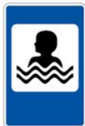
7.17 БАССЕЙН ИЛИ ПЛЯЖ