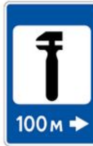
7.4 ТЕХНИЧЕСКОЕ ОБСЛУЖИВАНИЕ АВТОМОБИЛЕЙ 100 м →