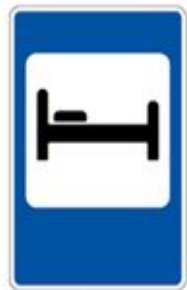
7.9 ГОСТИНИЦА ИЛИ МОТЕЛЬ