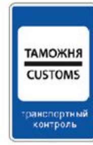
7.14.1 ПУНКТ ТАМОЖЕННОГО КОНТРОЛЯ