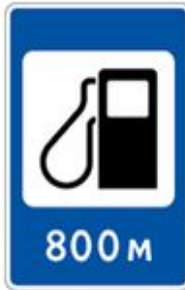
7.3 АВТОЗАПРАВочная СТАНЦИЯ 800 м