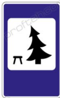
7.11 Место отдыха