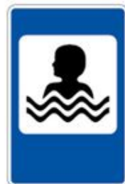
7.17 БАССЕЙН ИЛИ ПЛЯЖ