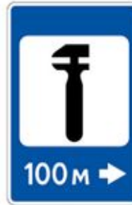
7.4 ТЕХНИЧЕСКОЕ ОБСЛУЖИВАНИЕ АВТОМОБИЛЕЙ