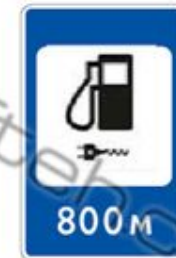
7.21 АВТОЗАПРАВочная СТАНЦИЯ С ВОЗМОЖНОСТЬЮ ЗАРЯДКИ ЭЛЕКТРОМОБИЛЕЙ