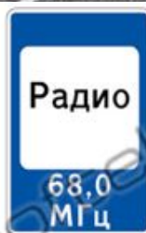
7.15 ЗОНА ПРИЕМА РАДИОСТАНЦИИ, ПЕРЕДАЮЩЕЙ ИНФОРМАЦИЮ О ДОРОЖНОМ ДВИЖЕНИИ