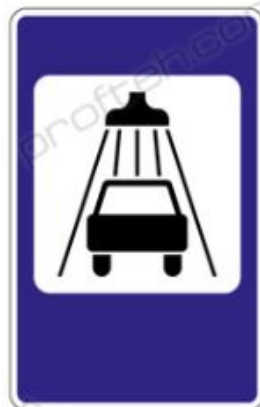
7.5 Мойка автомобилей