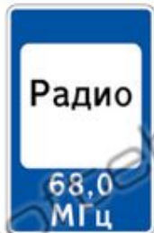
7.15 ЗОНА ПРИЕМА РАДИОСТАНЦИИ, ПЕРЕДАЮЩЕЙ ИНФОРМАЦИЮ О ДОРОЖНОМ ДВИЖЕНИИ