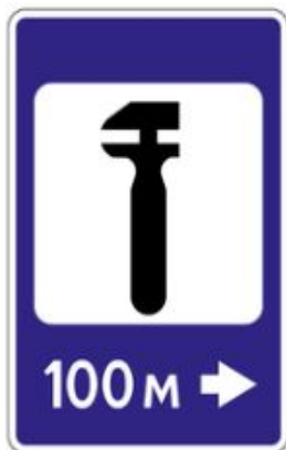
7.4 Техническое обслуживание автомобилей