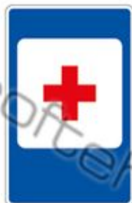
7.1 ПУНКТ ПЕРВОЙ МЕДИЦИНСКОЙ ПОМОЩИ