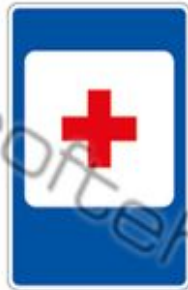
7.1 ПУНКТ ПЕРВОЙ МЕДИЦИНСКОЙ ПОМОЩИ