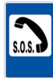
7.19 ТЕЛЕФОН ЭКСТРЕННОЙ СВЯЗИ