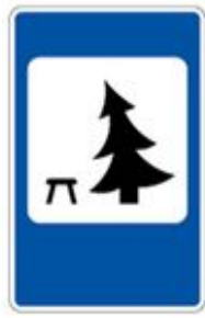
7.11 МЕСТО ОТДЫХА