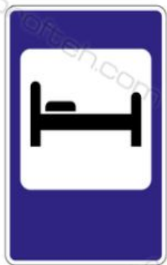
7.9 Гостиница или мотель