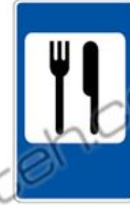
7.7 ПУНКТ ПИТАНИЯ