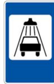
7.5 МОЙКА АВТОМОБИЛЕЙ