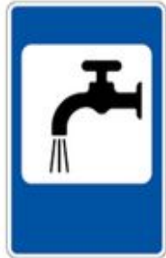
7.8 ПИТЬЕВАЯ ВОДА