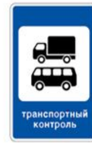
7.14 ПУНКТ КОНТРОЛЯ МЕЖДУНАРОДНЫХ АВТОМОБИЛЬНЫХ ПЕРЕВОЗК