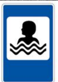
7.17 БАССЕЙН ИЛИ ПЛЯЖ