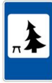
7.11 МЕСТО ОТДЫХА