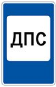
7.12 ПОСТ ДОРОЖНО-ПАРУЛЬНОЙ СЛУЖБЫ