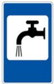
7.8 ПИТЬЕВАЯ ВОДА