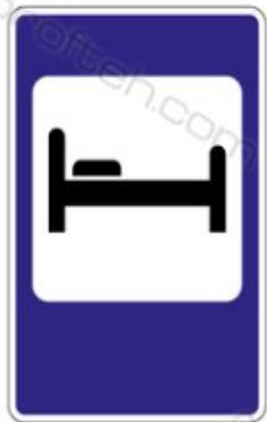
7.9 Гостиница или мотель