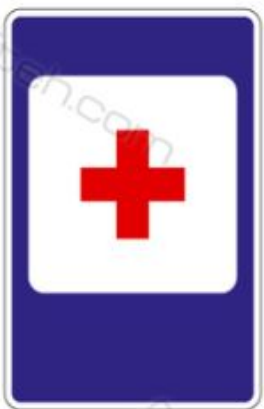
7.1 Пункт медицинской помощи