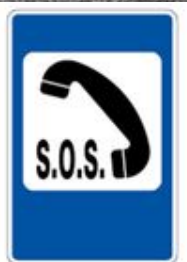
7.19 ТЕЛЕФОН ЭКСТРЕННОЙ СВЯЗИ