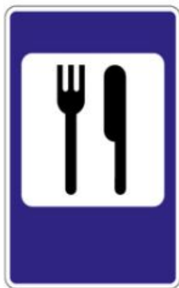
7.7 Пункт питания