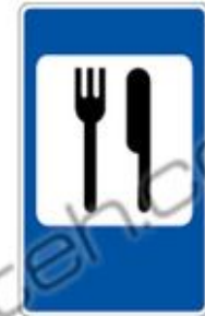
7.7 ПУНКТ ПИТАНИЯ