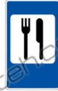
7.7 ПУНКТ ПИТАНИЯ