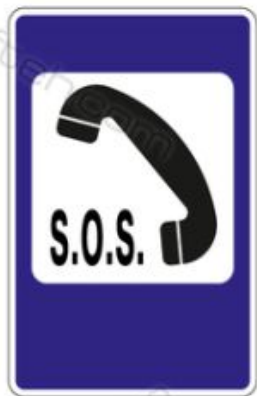
7.19 Телефон экстренной службы