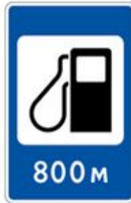
7.3 АВТОЗАПРАВочная СТАНЦИЯ