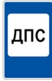
7.12 ПОСТ ДОРОЖНО-ПАРУЛЬНОЙ СЛУЖБЫ