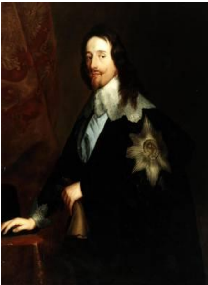
Карл I (1600—1649)