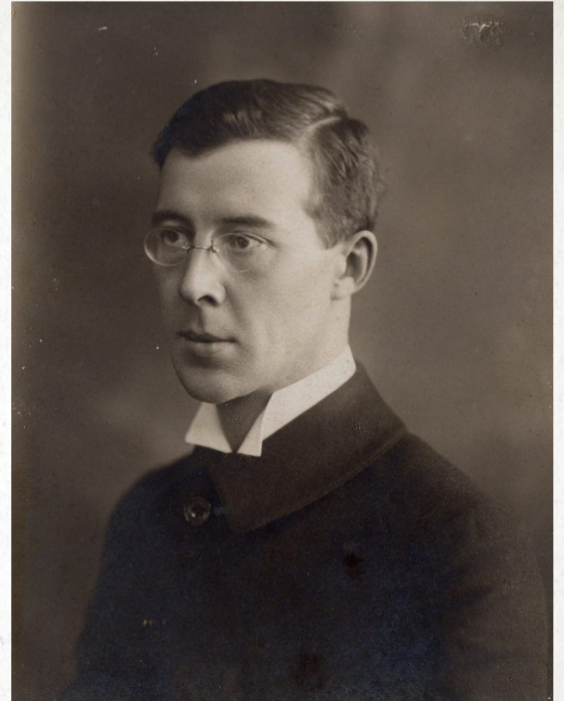
П. А. Сорокин

Центральный принцип культуры можно понимать как «культурный менталитет».