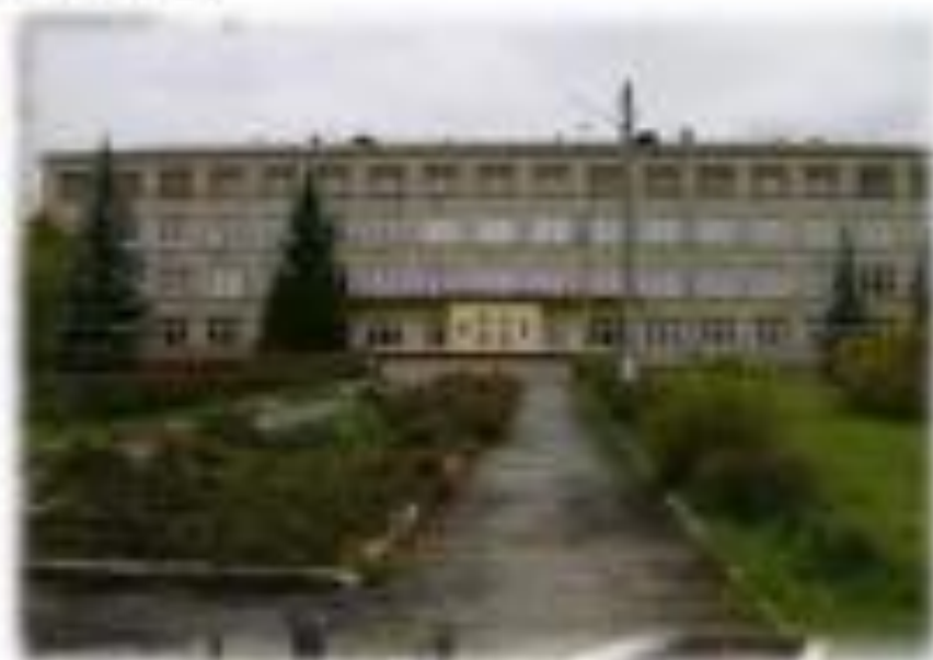
Энергостроительный техникум Челябинского государственного университета