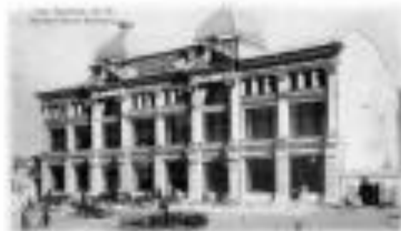
Пассаж Бр. Южных

Город становится жемчужиной архитектуры на Южном Урале.