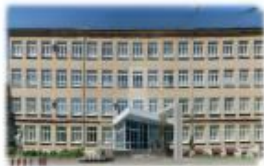
Авиационный технический колледж Уральская государственная академия ветеринарной медицины

В городе находится Уральская государственная академия ветеринарной медицины. Филиалы Челябинского государственного университета и современного гуманитарного института. Авиационный технический и педагогический колледжи, энергостроительный и аграрный техникумы, медицинское училище.