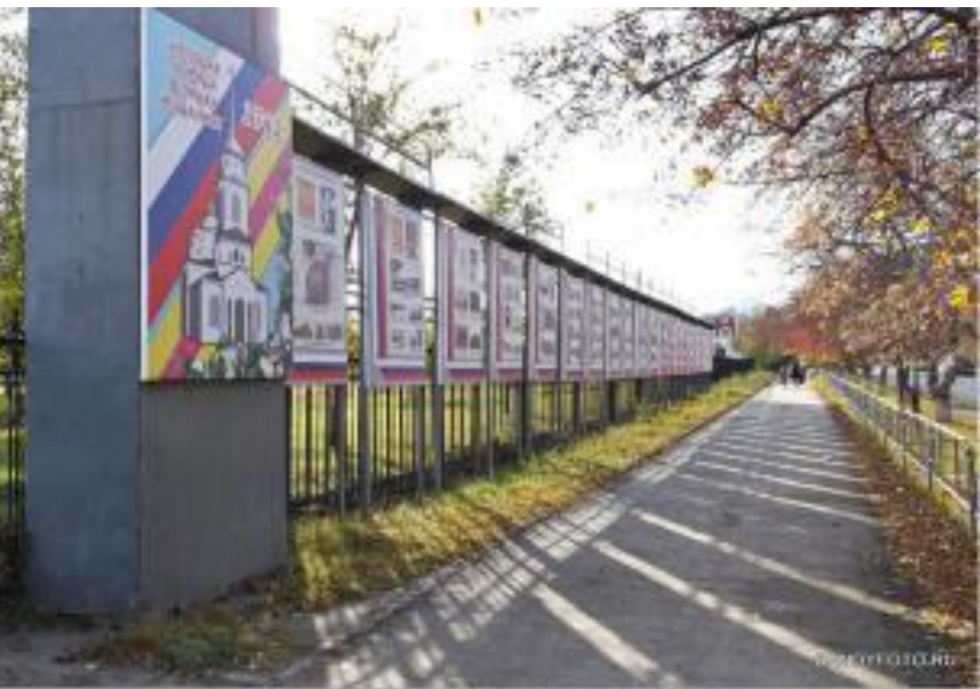
Здание Троцкого мирового комбината История города Троцка в лицах и зданиях, экспозиция по улице Гатерниа