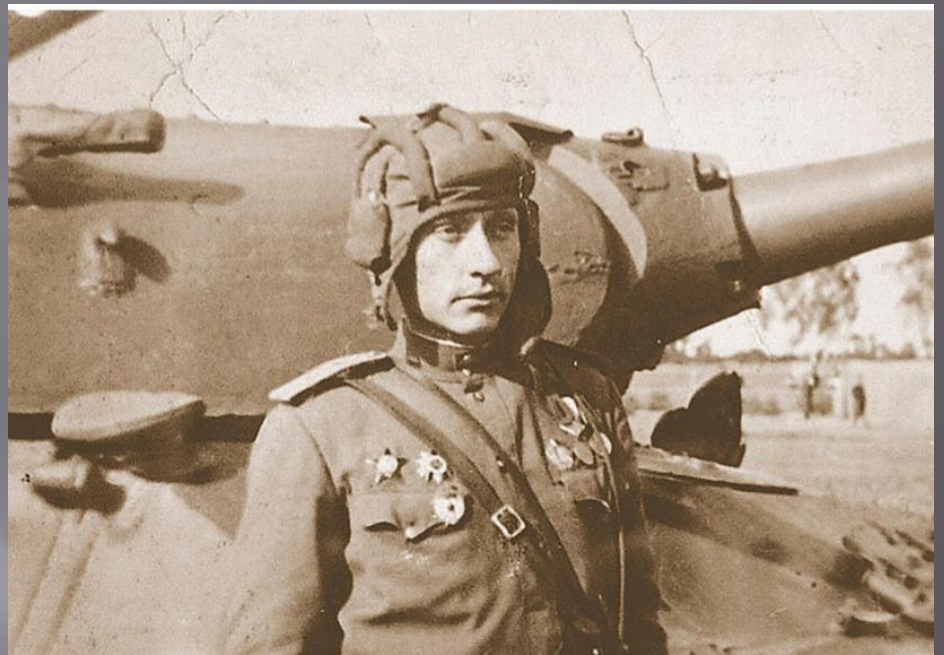
Андрэй Міхайлавіч Усаў (1917 – 1986)

Тов.УСОВ является командиром орудия танка командира роты ст. лейтенанта т.КОЛУБАНОВА. 20.8.41г. в направлении совхоза Войсковица была обнаружена колонна фашистских танков. Тов.УСОВ открыл меткий артиллерийский огонь по ним. Уничтожив два передних танка, тов.УСОВ по приказу командира роты перенес огонь в хвост колонны. Уничтожив два последних танка, тов.УСОВ переносит огонь на оставшиеся фашистские танки. В результате меткого артиллерийского огня экипажем уничтожено 22 фашистских танка.