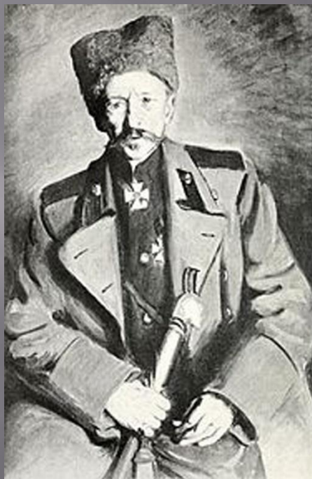
Васіль Іосіфавіч Гурко