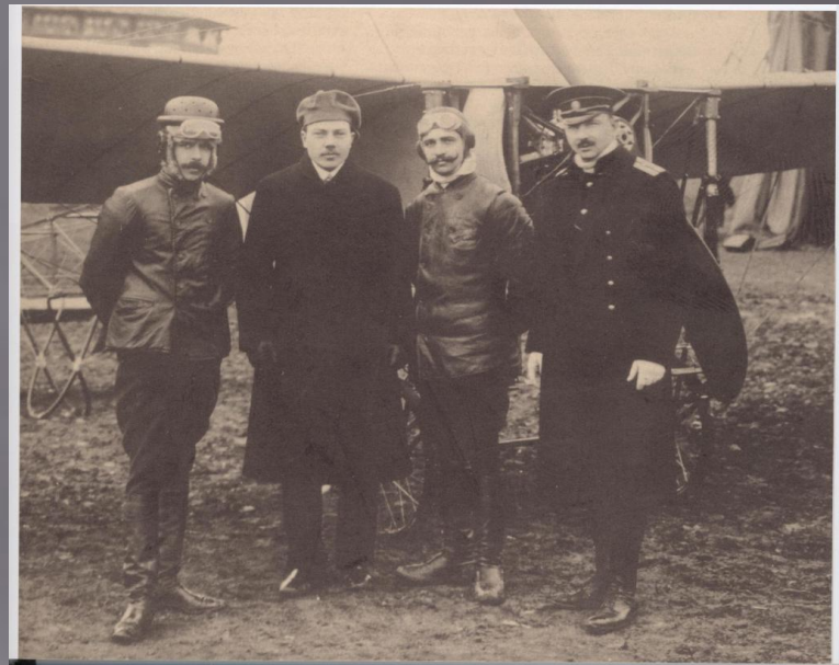
ССЕРОССИЙСКИЙ ПРАЗДНИКЪ ВОЗДУХОПЛАВАНІЯ.