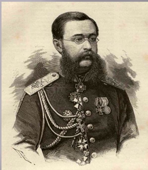
Казімір Васільєвіч Лявіцкі