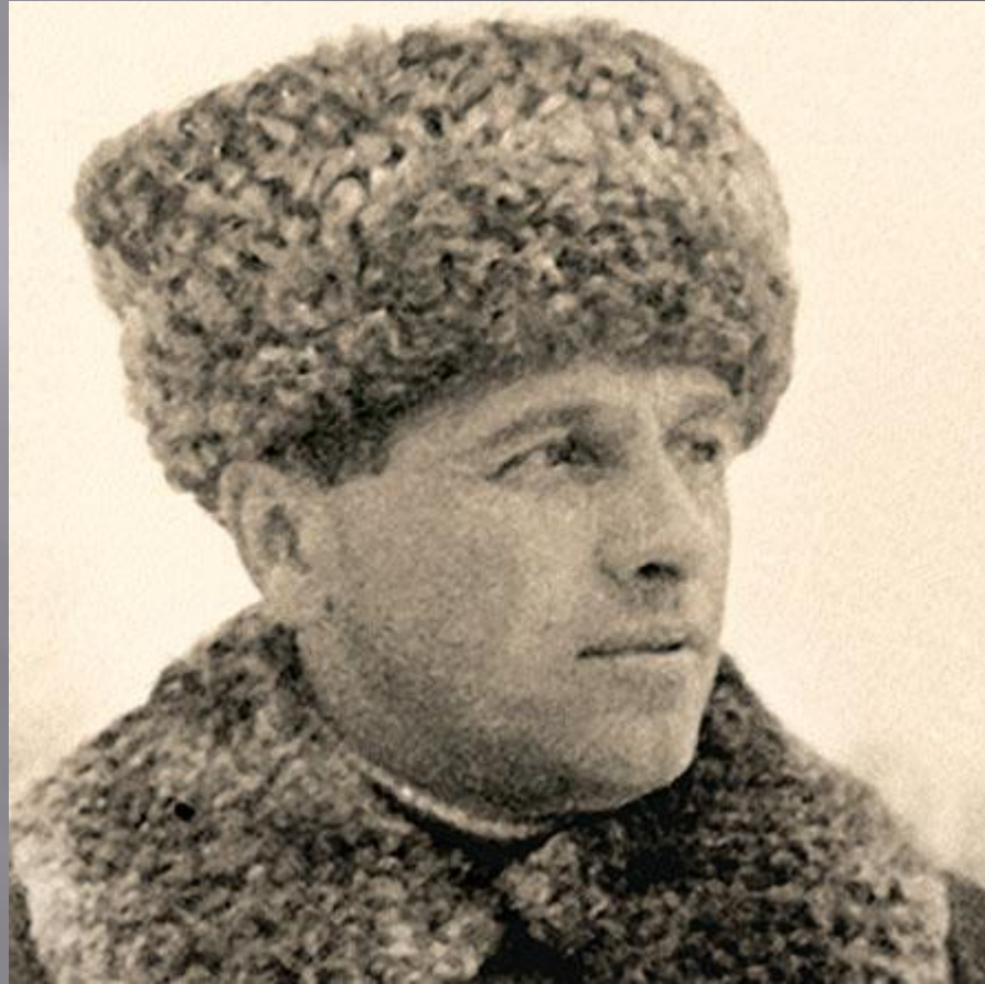
Леў Даватар. (1903-1941)