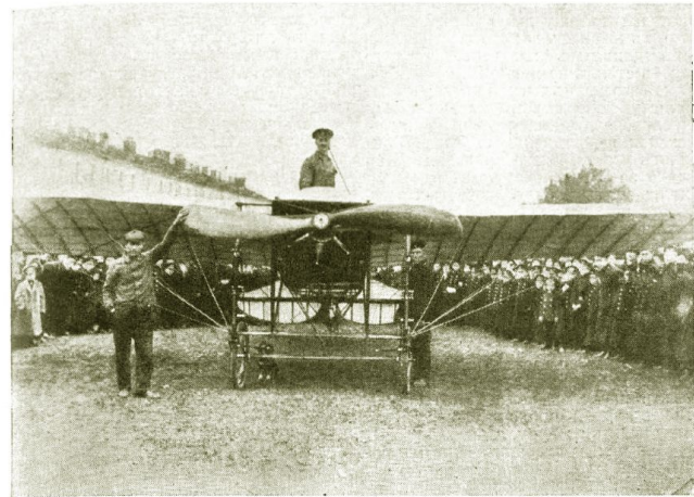
Лейт. ПІТРОВСКИЙ готовится к полету из Кронштадта.