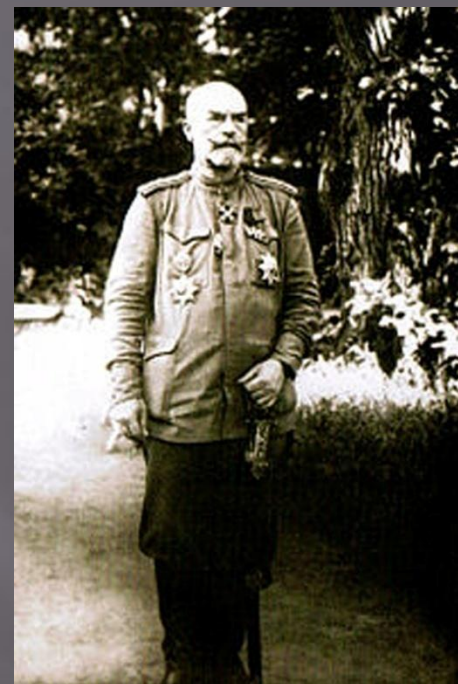
Аляксандр Францавіч Рагоза