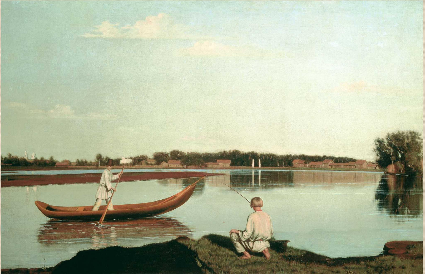
Григорий Васильевич Сорока (1823–1864). Рыбаки. Середина 1840-х годов