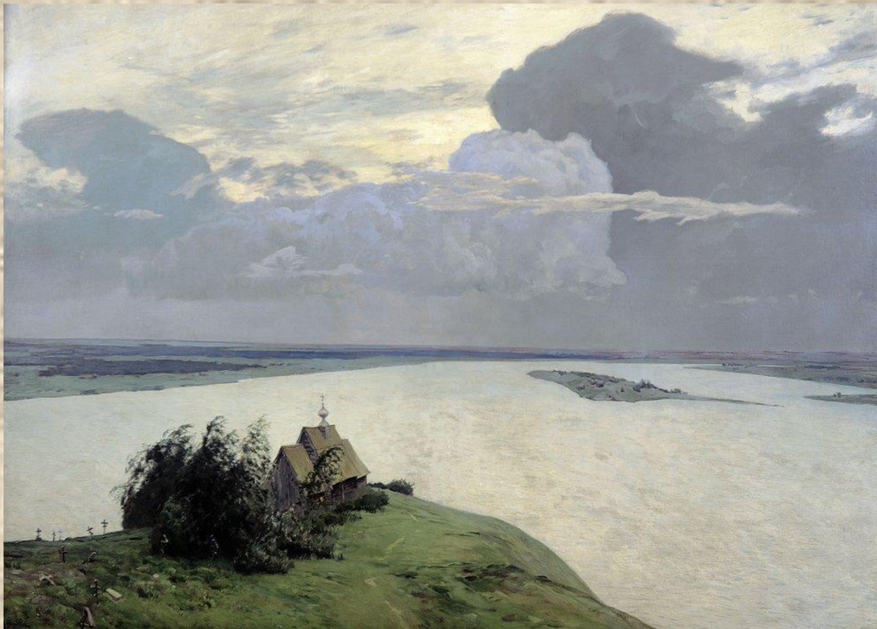
Исаак Ильич Левитан. Над вечным покоем. 1894