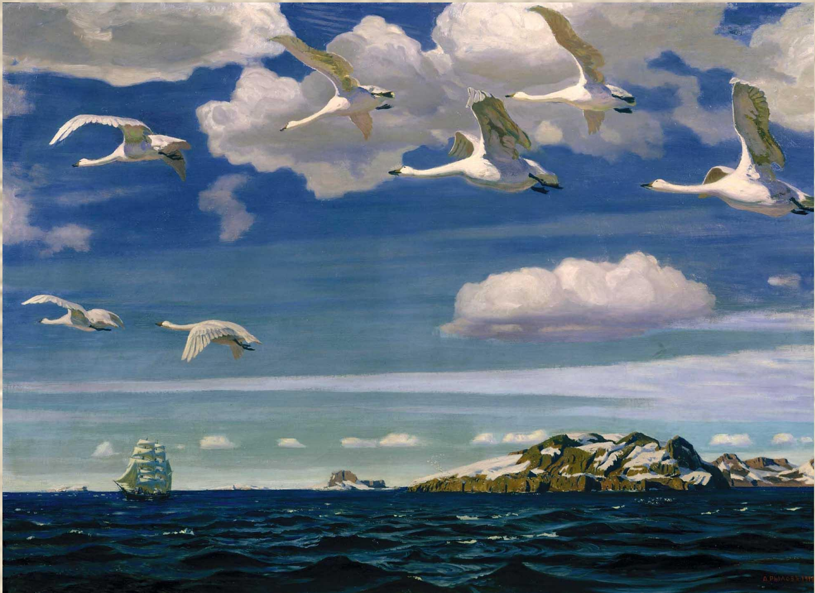
Аркадий Александрович Рылов. В голубом просторе. 1918