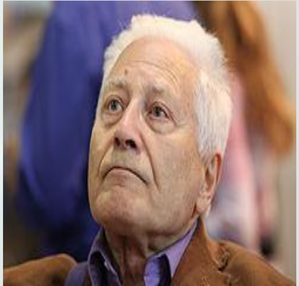
ИГОРЬ СЕМЁНОВИЧ КОН

Учителя и родители часто любой ценой стараются «замкнуть» самоуважение ребенка на учебной успеваемости, не принимая во внимание его достижений в других сферах деятельности. Тем самым они придают его жизненным целям и его самосознанию опасную односторонность, которая в случае неудачи в учебе может обернуться долгосрочным чувством личной неполноценности