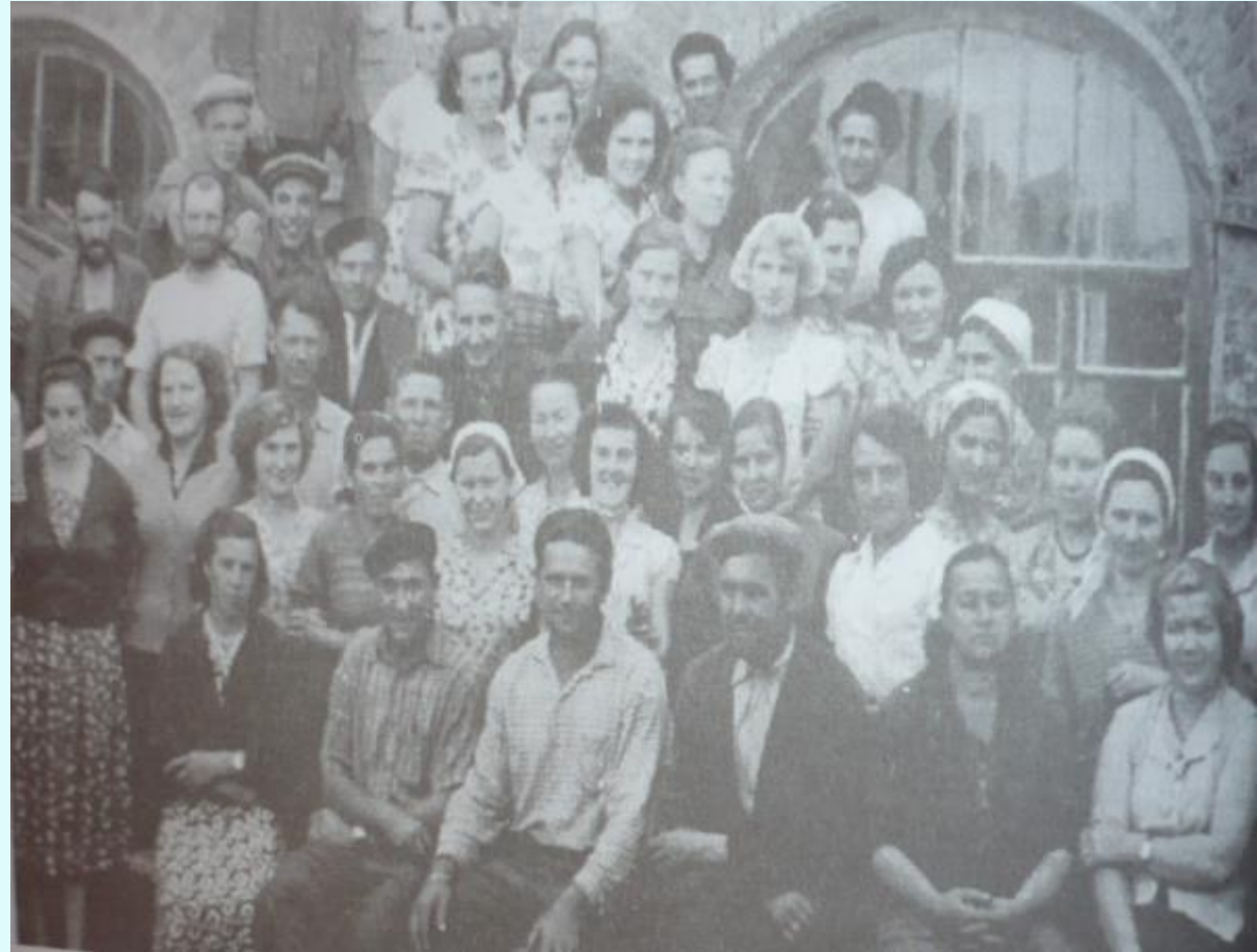
Рабочие и служащие Бабенской артели

В 1968 году Бабенская фабрика вместе с Кузнецовской была передана Наро-Фоминской фабрике. С этого времени она теряет свою самостоятельность. В 1972 году Бабенский цех передают Подольской фабрике деревянных игрушек (ныне КЛИМО).