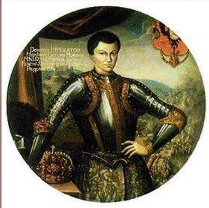
Лжедмитрий I (Дмитрий Иванович)

В 1601г. в Польско-Литовском государстве объявился самозванец, заявивший, что он – «чудом спасшийся» царевич Дмитрий. Это был беглый монах Григорий Отрепьев. Польский король и воевода Мнишек помогли Лжедмитрию собрать войско для похода в Россию.