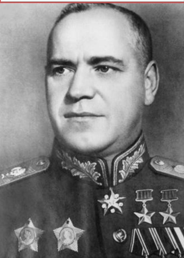
Дважды Герой Советского Союза Маршал Советского Союза Г.К. Жуков, 1945 г.

1-ГО БЕЛОРУССКОГО ФРОНТА ГЕОРГИЯ КОНСТАНТИНОВИЧА ЖУКОВА