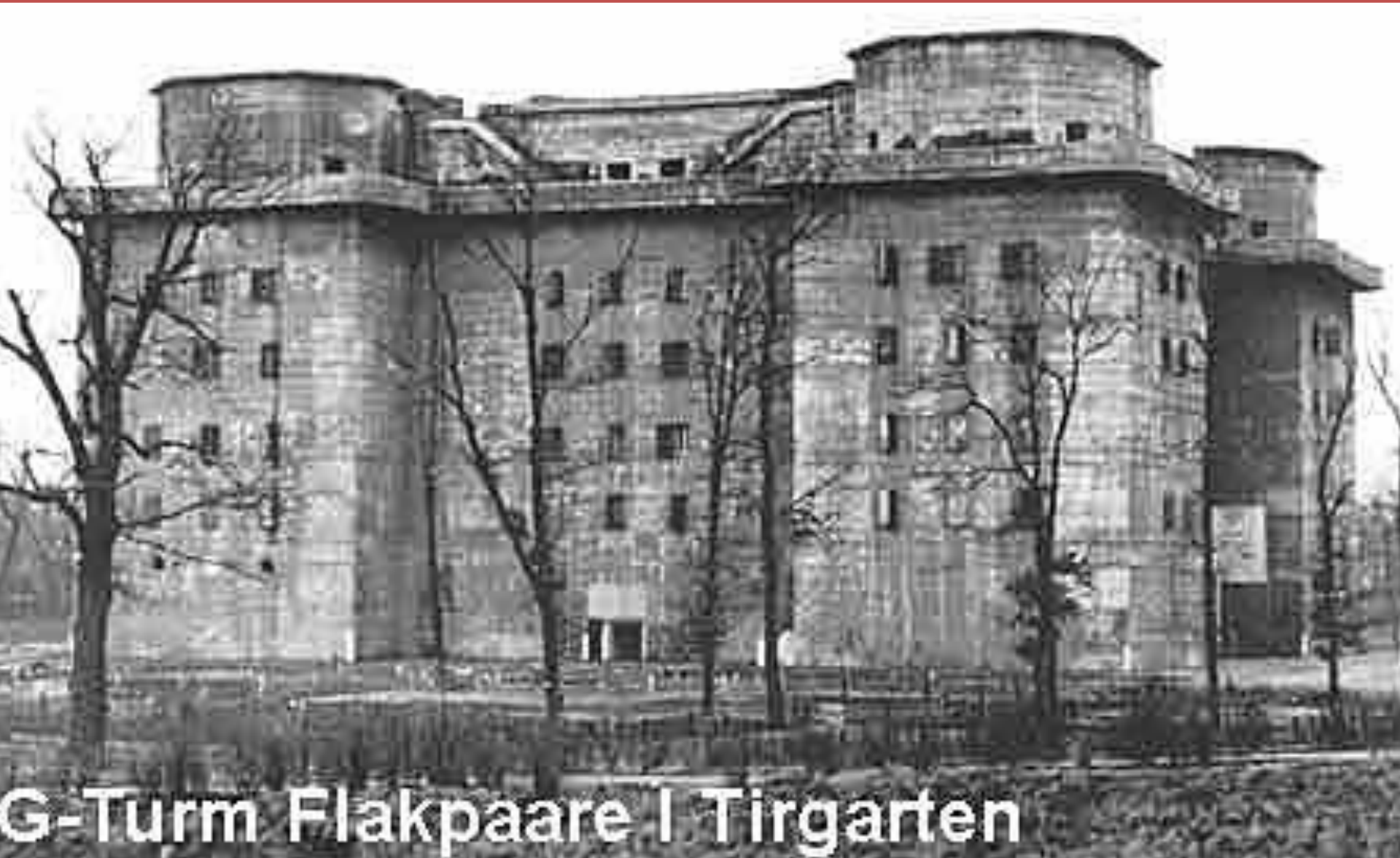
G-Turm Flakzaare I Turgarten

ДЛЯ ЗАЩИТЫ ОТ БОМБАРДИРОВОК В ГОРОДЕ ВОЗВЕЛИ ТРИ ГИГАНТСКИЕ БАШНИ ПВО. НА КРЫШАХ БЕТОННЫХ СТРОЕНИЙ ВЫСОТОЙ ОКОЛО 40 М УСТАНАВЛИВАЛИСЬ ЗЕНИТНЫЕ ОРУДИЯ И АВТОМАТИЧЕСКИЕ ЗЕНИТНЫЕ ПУШКИ.