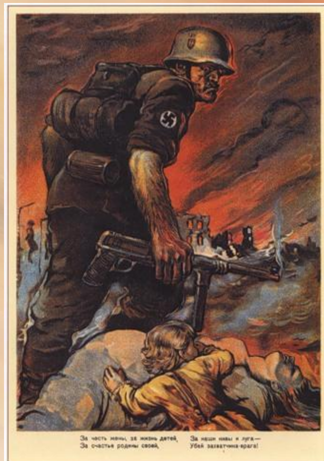
294, Голованов Л. За честь жены, за жизнь детей, <...> убей захватчика-врага! 1942