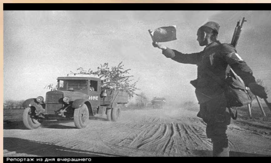
Репортаж из дня вчерашнего