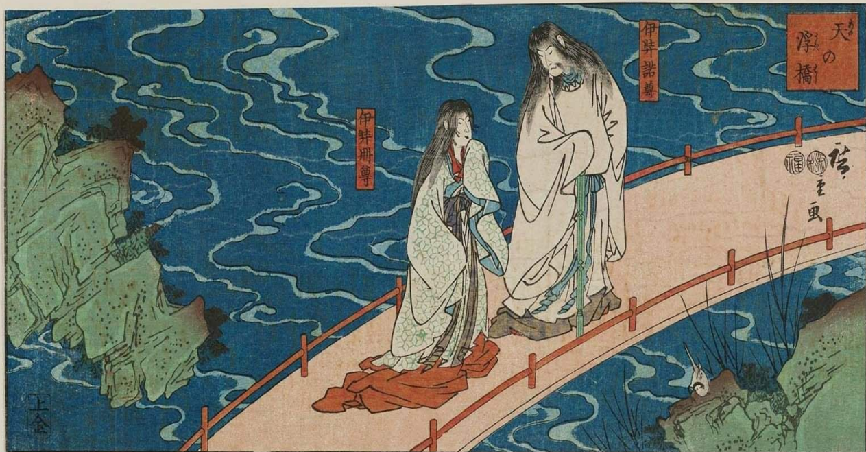
идзанаги и идзанами