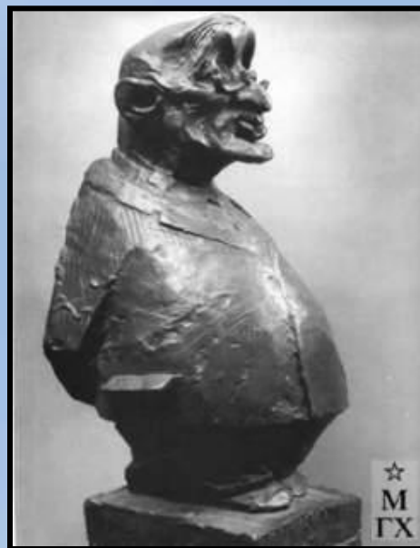
И.Грабарь. Дружеский шарж. 1962