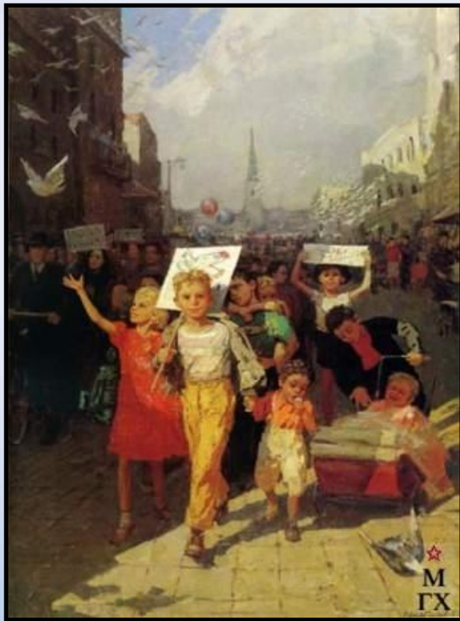
«Голуби мира» 1956