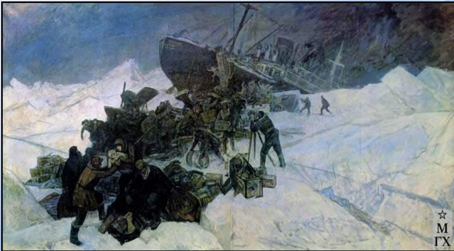
«Гибель «Челюскина» 1934