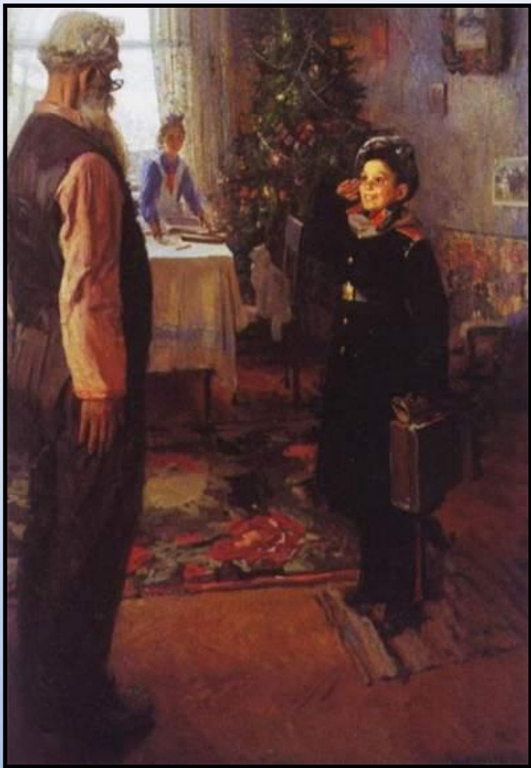
«Прибыл на каникулы» 1948