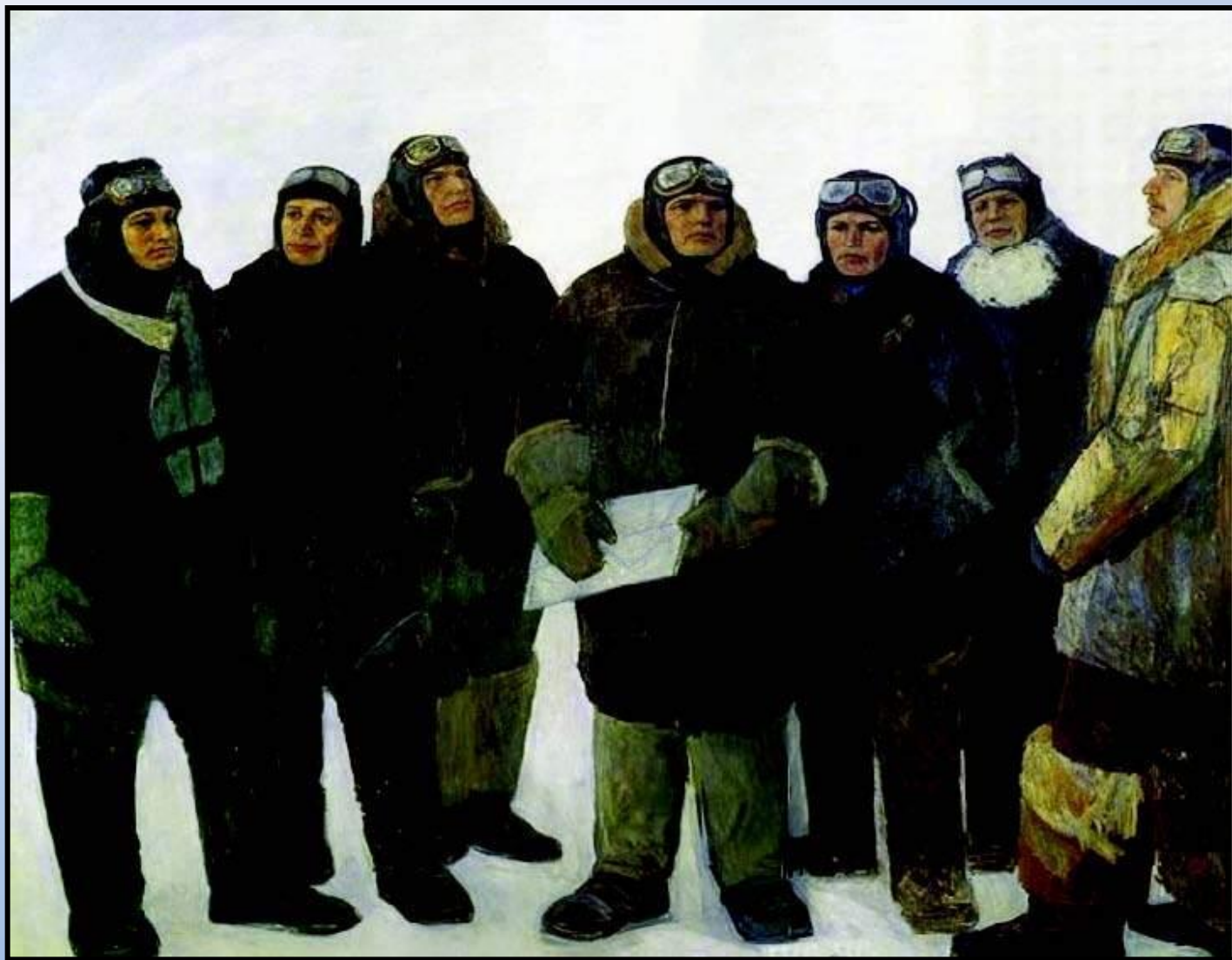
Первые Герои Советского Союза. А.В. Ляпидевский, В.С. Молоков, С.А. Леваневский, М.В. Водопьянов, Н.М. Каманин, И.В. Доронин, М.Т. Слепнев