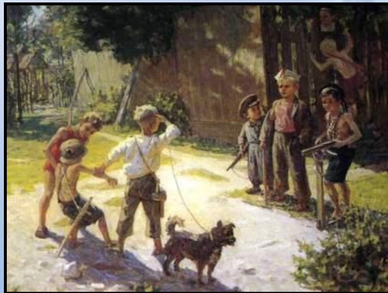
«Достали языка» 1943