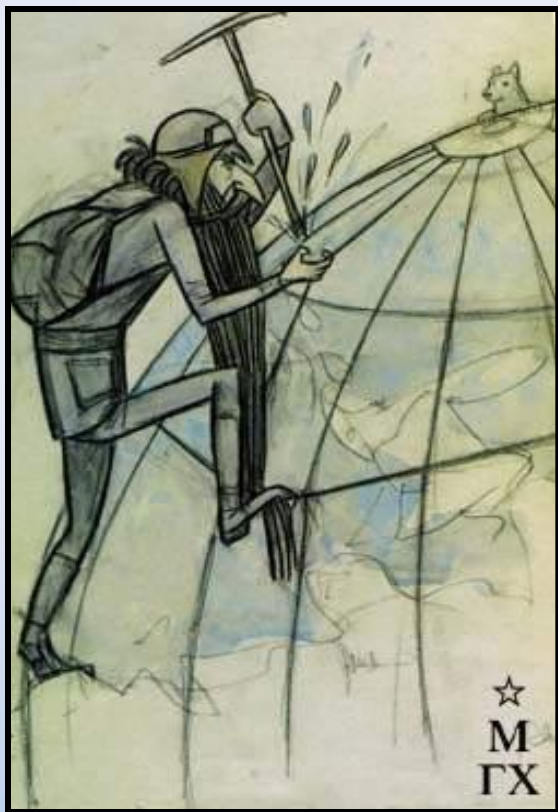
О.Ю. Шмидт на подступах к Северному полюсу. Дружеский шарж. 1934