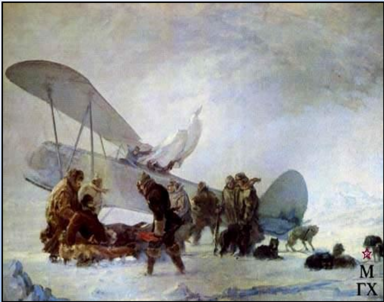
Больной О.Ю. Шмидт покидает лагерь челюскинцев. 1934