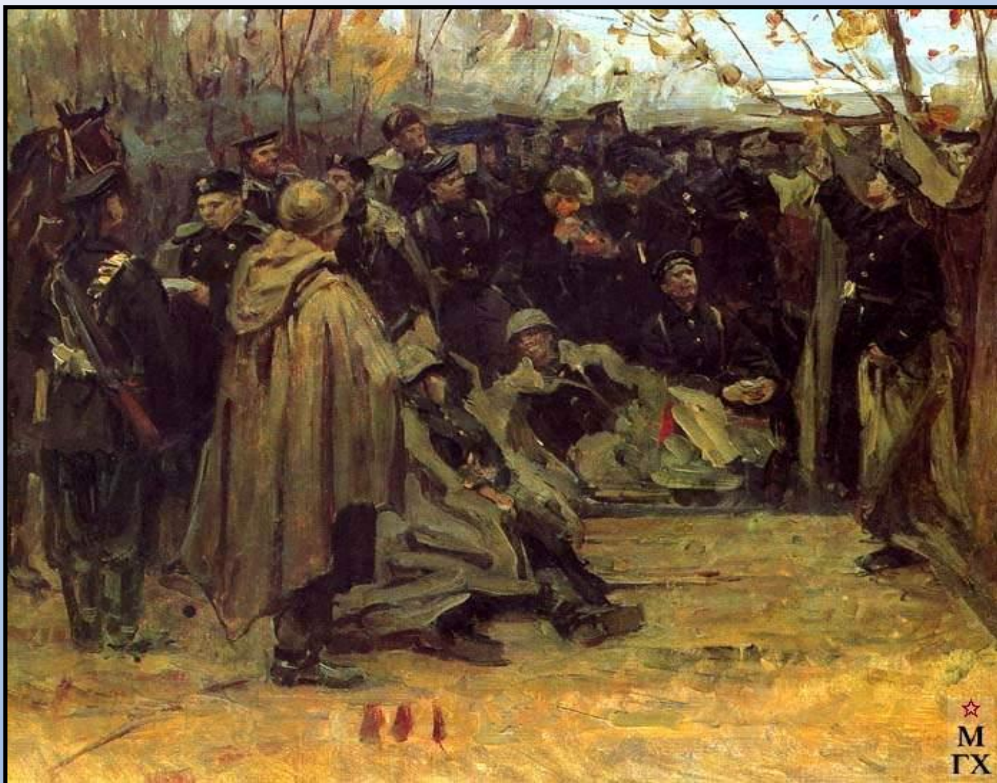
В отряде морской пехоты. Севастополь 1942 года. 1942