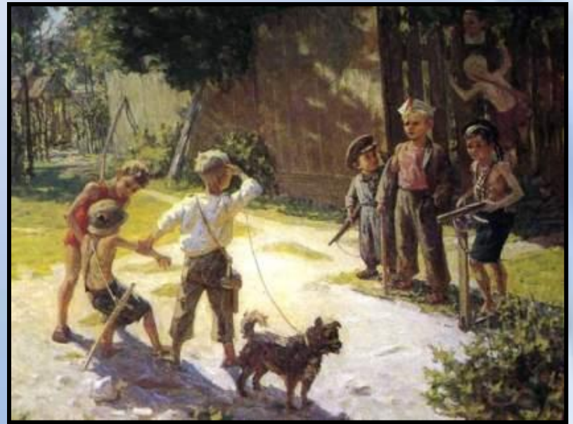
«Достали языка» 1943