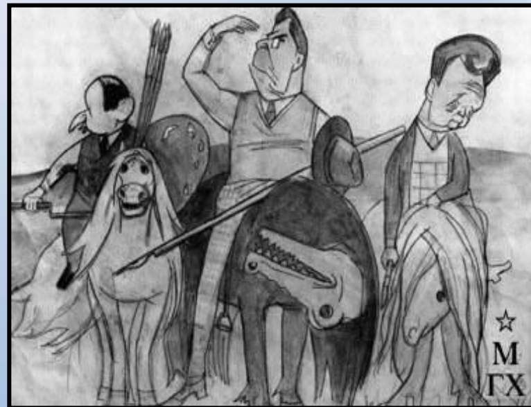
Кукрыниксы. Три богатыря. 1958.