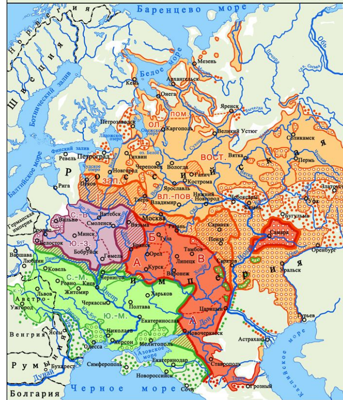
Диалектологическая карта русского языка в Европе (1915 г.)