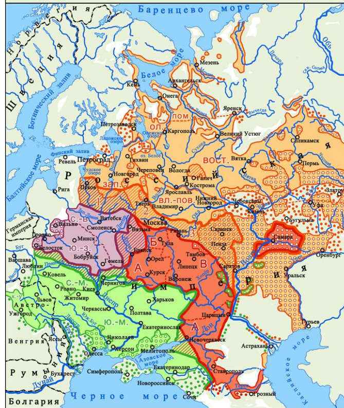
Диалектологическая карта русского языка в Европе (1915 г.)